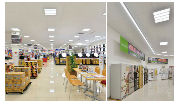
売場の照明①②③ (左)生活家電コーナーよりエントランス方向を望む (右)壁に沿って連結設置されたTENQOOシリーズ直付形の光のライン