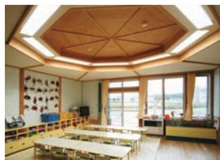
2歳児保育室の照明