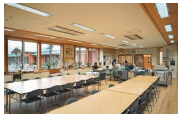
職員室の照明：32WHf蛍光ランプOAルーバ付埋込器具を設置