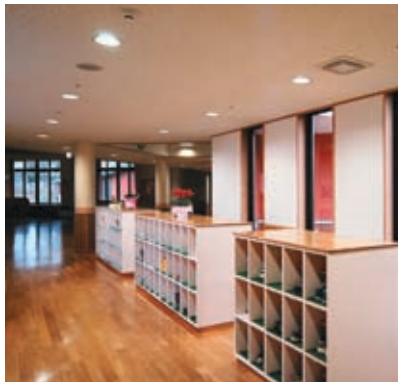
廊下の照明：高効率のダウンライトを配置