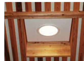
遊戯室の器具アップ