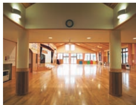
玄関周りの照明：上下配光器具で天井の杉板張りりと床面の明るさを確保