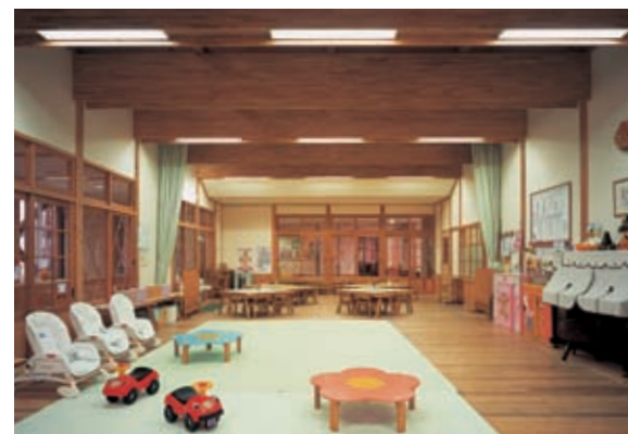
食堂・子育て支援センターの照明：32WHf蛍光ランプ直付器具を大梁部分内に収納