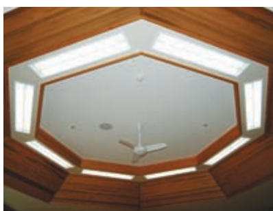
八角形配置にした照明器具