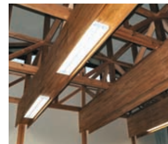
食堂・子育て支援センターの器具アップ