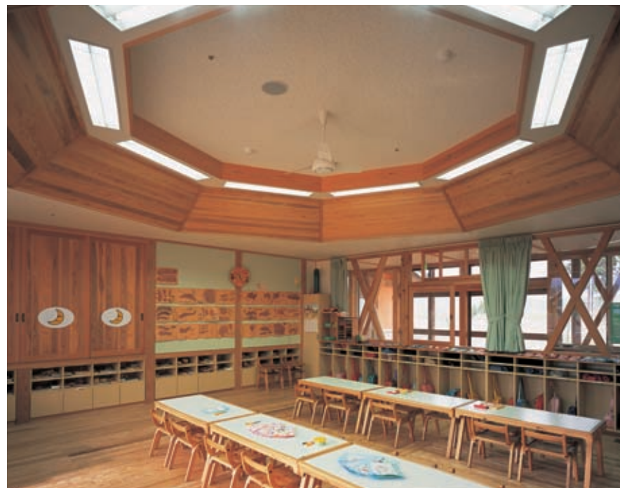
3～5歳児保育室の照明：天井意匠に合わせて照明器具を八角形配置