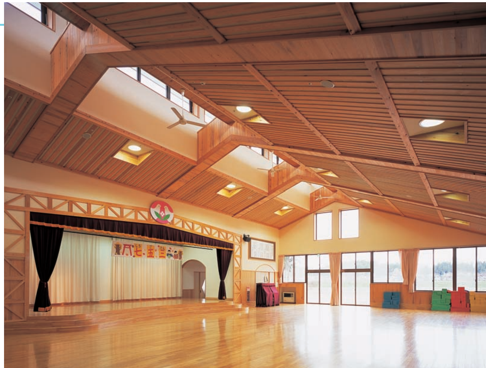
遊戯室の照明：メタルハライドランプダウンライト(電動昇降装置付)を建築意匠にフィットするよう照明部分を枠付フラット天井にして設置