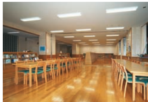
図書室の照明：32WHf蛍光灯2灯用埋込器具を整列配置