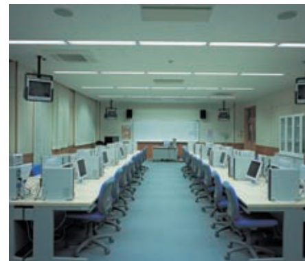
パソコン・視覚教室：32WHf蛍光灯2灯用埋込器具OAルーバ付5連結をライン配置