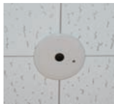
普通教室・オープンスペースのあかりセンサ