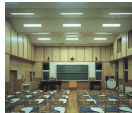
音楽教室の照明：32WHf蛍光灯2灯用埋込器具ルーバ付を設置