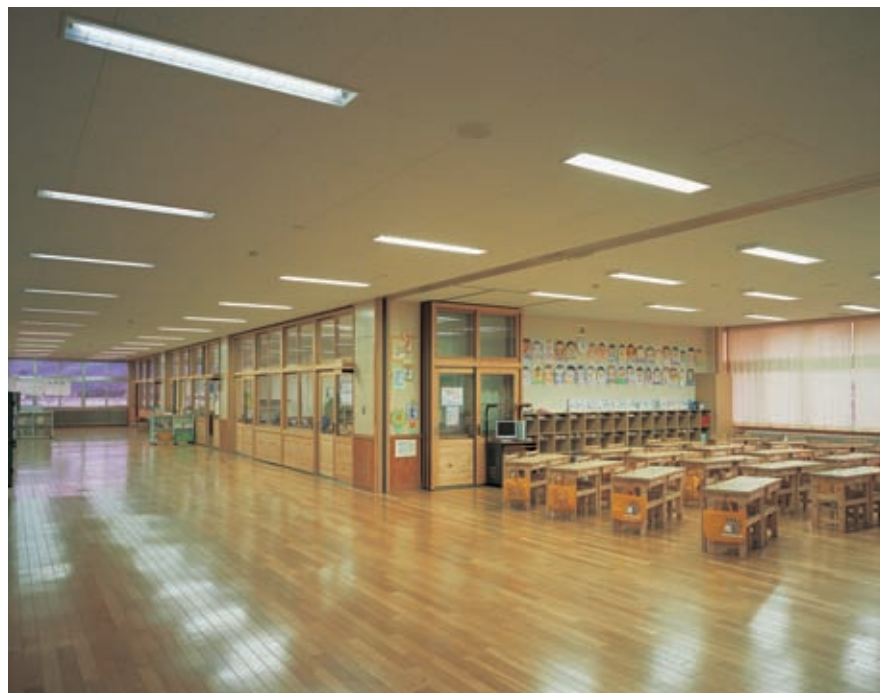
オープンスペースの照明：32WHf蛍光灯2灯用埋込器具バツフル付(調光タイプ)を採用