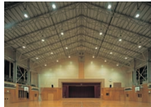
体育館の照明：400Wメタルハライドランプバンクライトebシリーズ(連続調光形)を分散配置