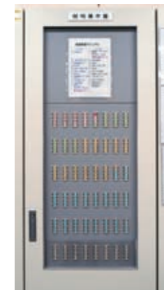
職員室に設置されているMESリモコン主操作盤