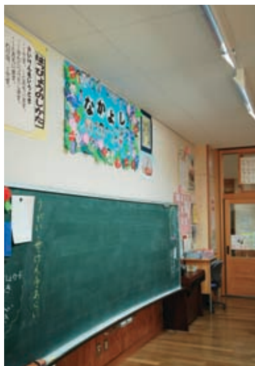
普通教室の黒板灯