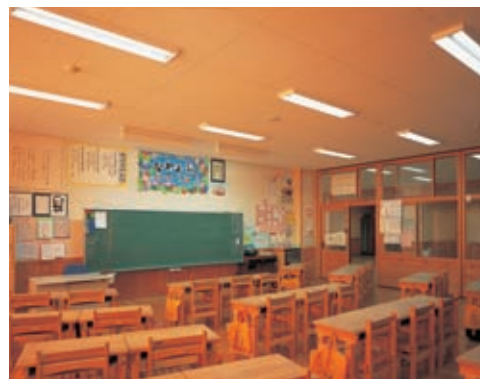
普通教室の照明：32WHf蛍光灯2灯用直付器具で昼光制御