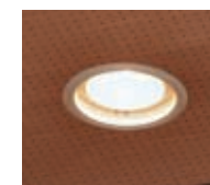
多目的ホールのハロゲンランプダウンライト