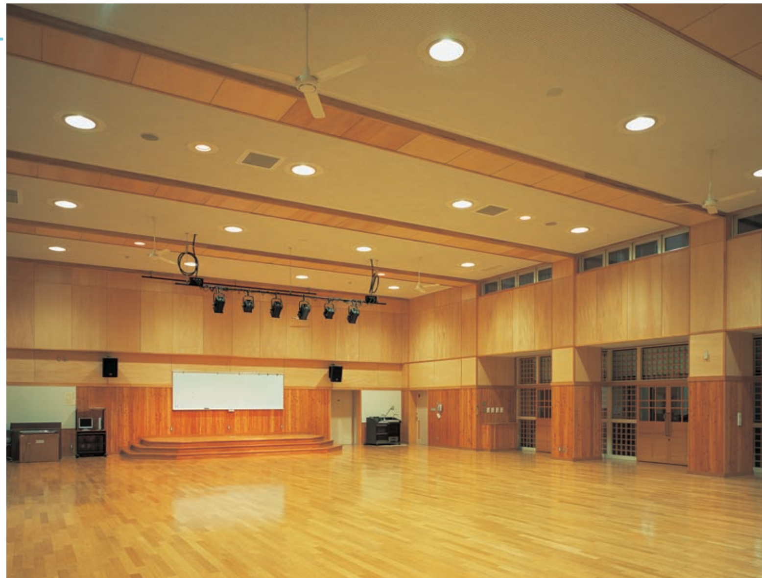
多目的ホールの照明：400Wメタルハライドランプと250Wハロゲンランプ(連続調光形)ダウンライトによる混光照明を採用