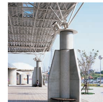
柱上部に設置されている投光器 Floodlights installed on the pillars