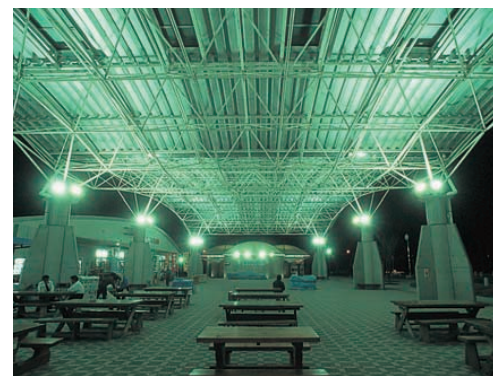
大屋根広場の1/2点灯時の夜景 Night view of the big roofed square lit with the half of the lighting capacity