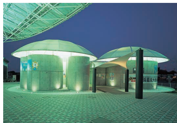
ドーム状の屋根をもつトイレ：透過性を持つ膜材の天井に投光器で照射。屋根からの漏れ光と外壁へのアップライトで明るさと光色のメリハリをつけている Lavatory house with dome