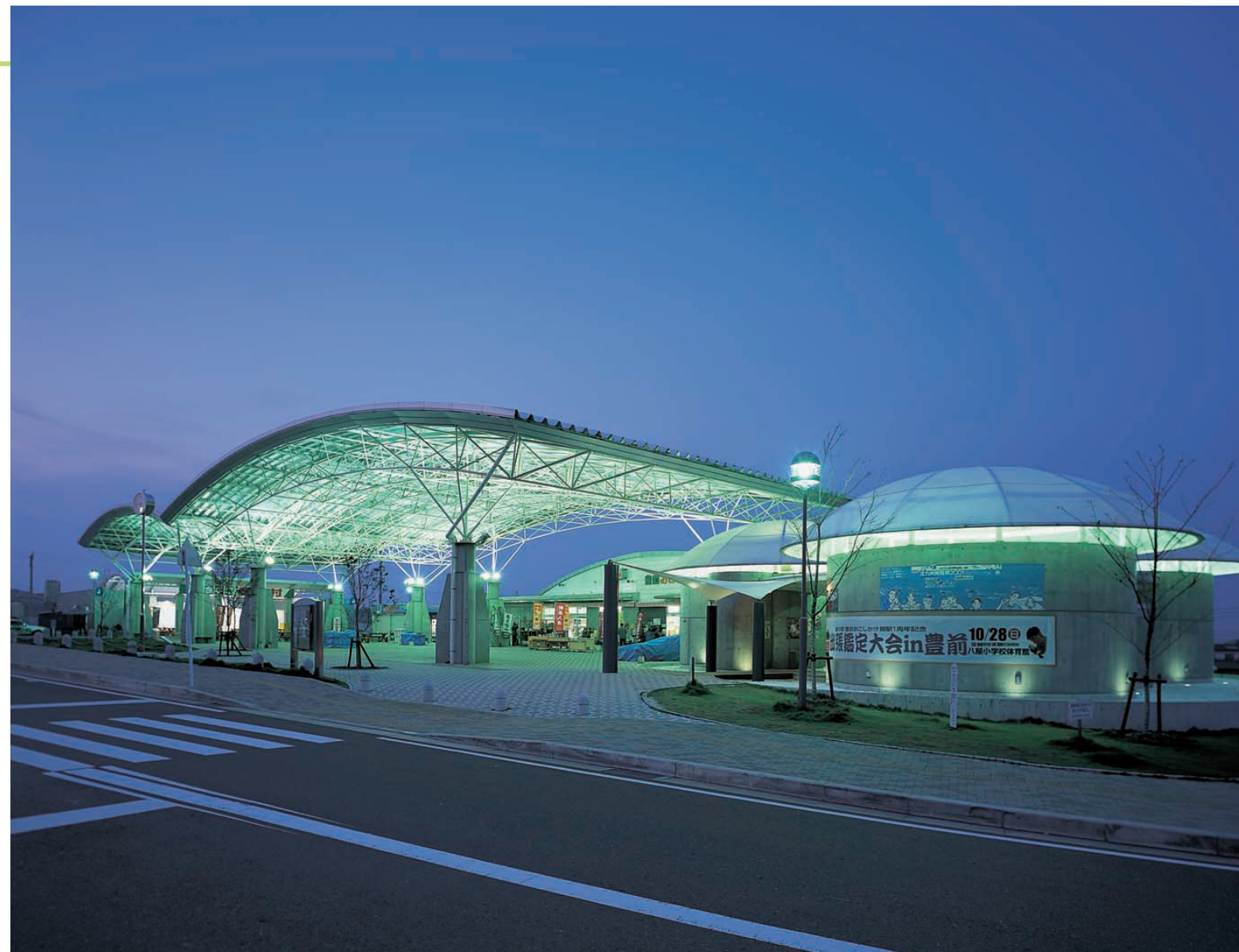
正面側からの夜景：屋根内側からの白色の反射光で広場全体が明るく、開放的な空間がつけられている Night view from the front