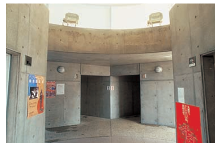
トイレの天井膜を照射している投光器 Floodlights light the ceiling of the lavatory