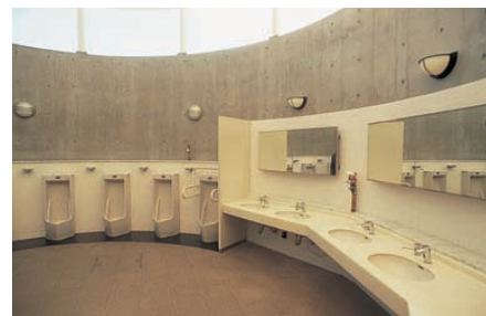
トイレ内の照明：ブラケットを設置し、快適性、清潔感を高めている Lighting within the facilities