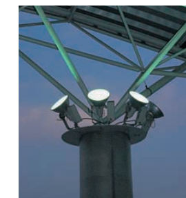
投光器アップ Close-up photo of floodlights