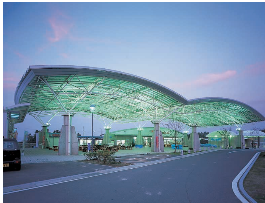
屋台村方向から望む大屋根広場：メタルハライドランプ投光器で屋根全体を下から照らし、屋根の意匠的な構造と空間の広がり感を演出 Big roofed square viewed from a 'village of stalls'