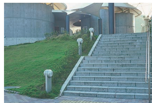
階段部に設置されたガーデンライト Garden lights installed on the stairway