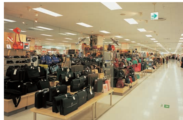
2階ファッション売場ゾーン Fashionable goods are on sale on the 2nd floor 1階暮らし売場ゾーンと同器具で色温度3,500Kの落ち着いた魅力のある店舗が得られている