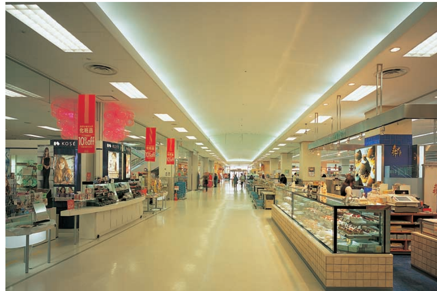
中央動線 建築化照明による間接光で、高級感のある空間を演出。また売場ゾーンを明確にして誘導性を高めている Central line of flow

特注の高効率反射板により、まぶしさを抑えながら明るく、均斉度のよい光環境を創出 パネルコントロール形SESLで省エネに配慮