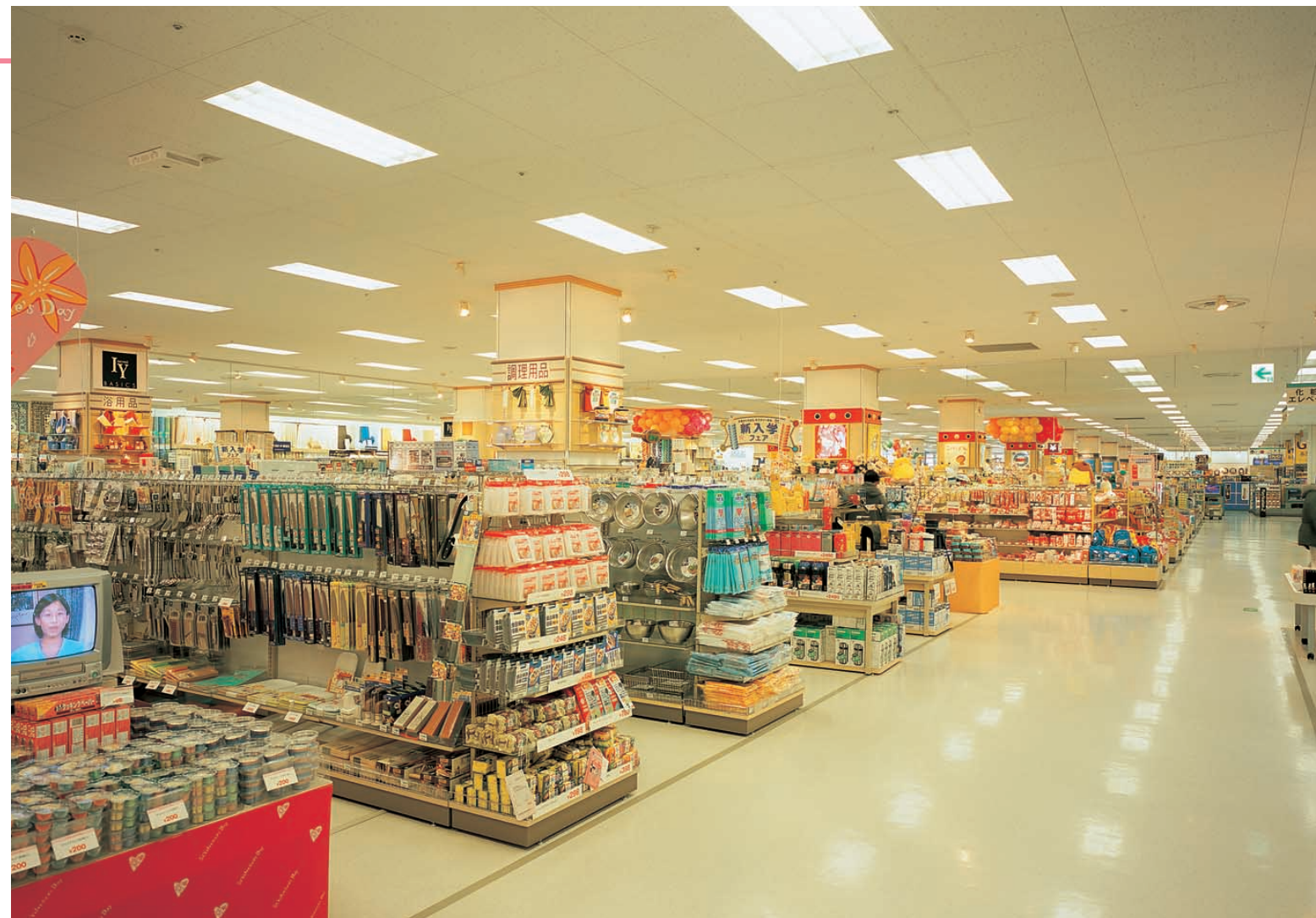
1階暮らし売場ゾーン Hf32W3灯用埋込器具パツフル付に高効率反射板を採用。グレアがなく、明るい均斉度のよい光環境を実現 Zone for household goods on the 1st floor