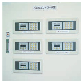
照明制御システム・SESLのパネルコントロール形を5台設置 5 panel control model of SESL lighting control systems are installed 店内全体の照明をきめ細かに制御し、大幅に省エネを実現している