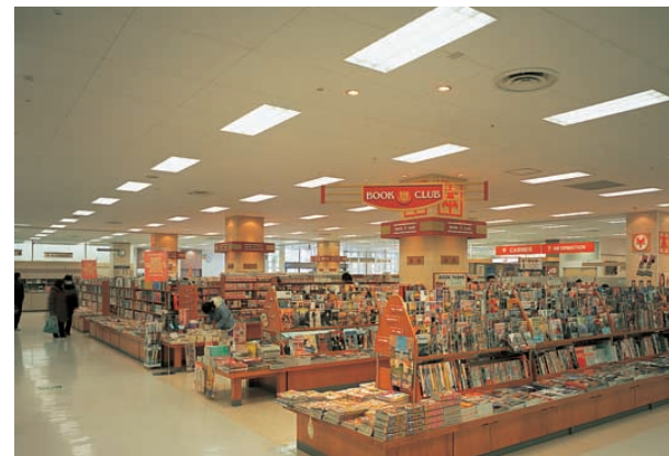
1階ブック売場ゾーン 温白色の光源の器具で暖かく、楽しいショッピング空間をつくり出している Book store on the 1st floor