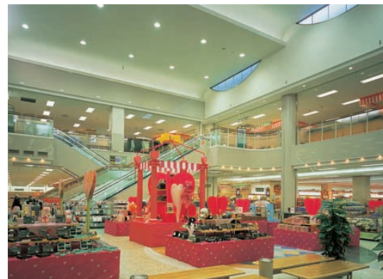
センターコート Center Court 400Wメタルハライドランプダウンライトで見通しのよい、くつろぎ感を演出した憩のスペース