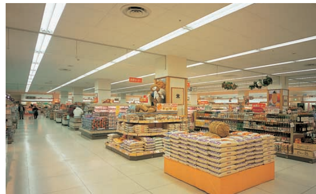
1階食品売場ゾーン Foodstuff zone on the 1st floor FL110W2灯用埋込器具により、圧迫感がなく、明るく新鮮な食品売場を形成