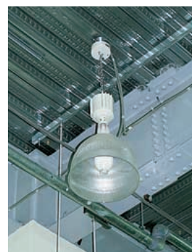
400Wメタルハライドランプロフトペンダントプリズムセードの取付状況