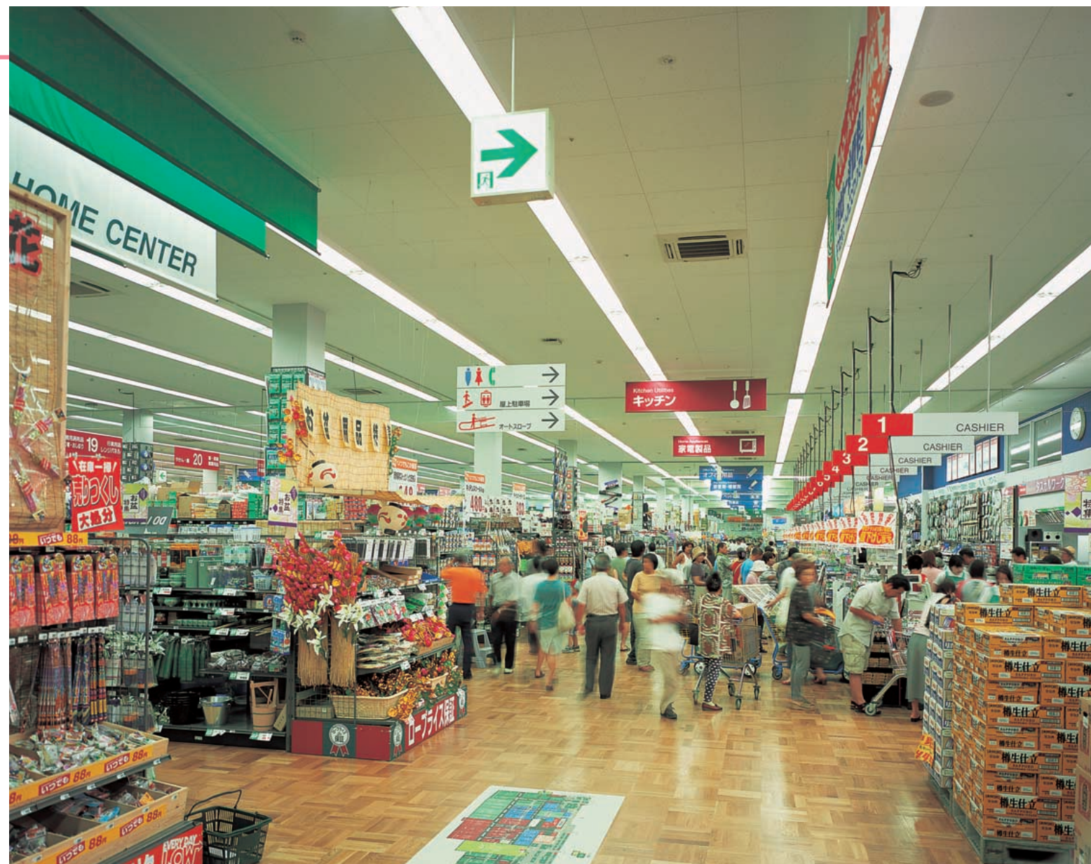
日用雑貨売場メイン通路：110W蛍光ランプ2灯用下面開放直付器具をライン状に連続配置し、昼白色の明かりで明るく活気ある商空間を得ている