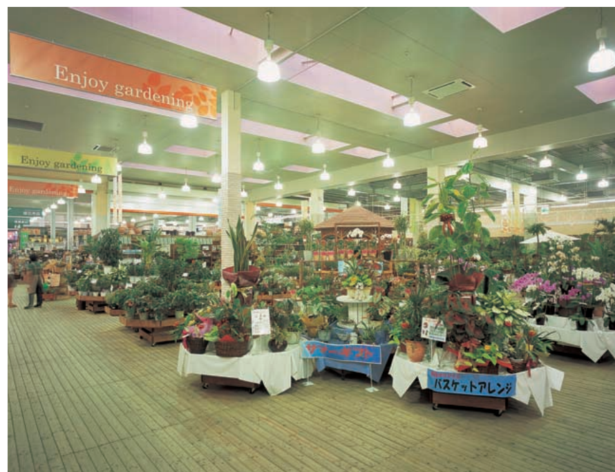
園芸館：400Wメタルハライドランプロフトペンダントプリズムセードを設置し、緑と花をさわやかな光色で再現

バラエティに豊かな豊富な商品を一般客コーナーに対しては、商品を見やすく、選びやすい照明環境の創出 資材館などプロを対象とするコーナーには、下方向に高演色の明かりを集光させ、商品を魅力的に際立たせる演出の工夫