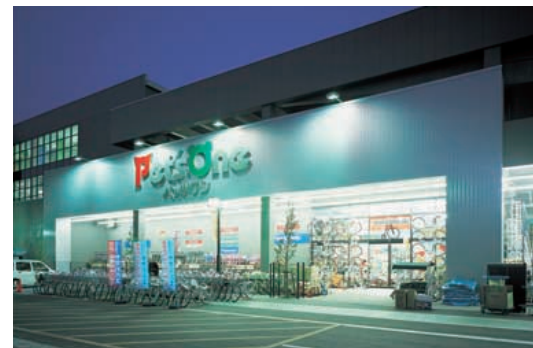
本館の看板照明：看板の上側にプレアサインの横長配光形4台を配置