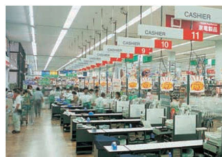
カウンター廻りの照明：商品確認のための明かり、スタッフの表情を好印象に見せる視環境が得られている