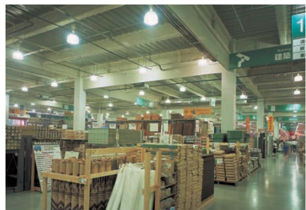
資材館：ロフト天井仕上げの空間を下方向に拡散照射しながら売場全体の明るさ感を演出している400Wメタルハライドランプロフトペンダントプリズムセード