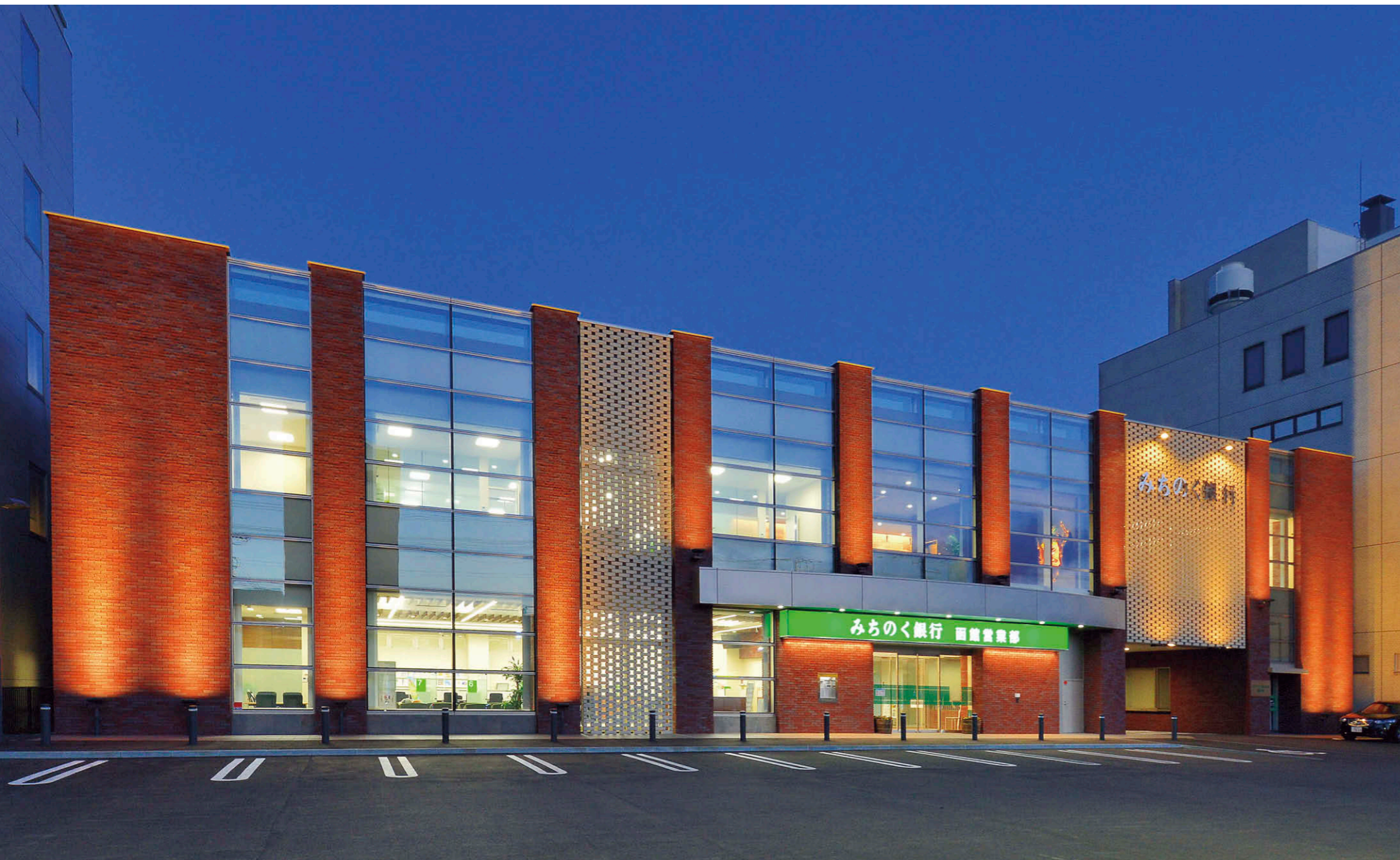
ライトアップされた外観 LED投光器①の光源が赤レンガを下から上へ照らし出し、カーテンウォールにはLED投光器①②を向かい合わせて設置。

【物件概要】 所在地：北海道函館市千歳町 9 番 10 号 建築面積：716.81㎡ 延床面積：1,299.93㎡ 構造・規模：鉄筋コンクリート造 2 階建 施工：(株)みちのく銀行 設計：(株)二本柳慶一建築研究所 電気：(株)新宮電気設備 完成時期：2017 年 9 月