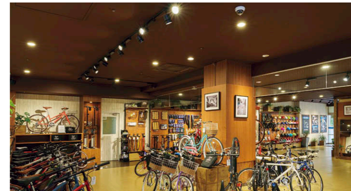
店舗奥側の展示コーナー 一本のライティングレール上でLEDスポットライト③を左 右に振り分けて設置し商品演出。地明かりはLEDライトエンジンダウンライト②