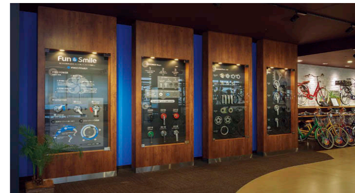
展示パネル LED一体形ダウンライト⑤をパネル内に設置し高級感のある雰囲気演出。