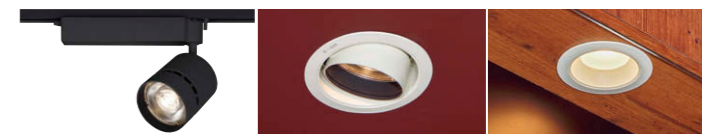
③ LEDスポットライ ト 2000シリーズ