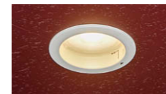
② LEDライトエンジ ンダウンライト