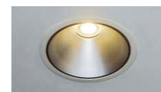
① 電源別置形LED ライトエンジンダウンライト