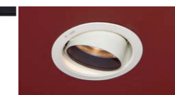
④ LEDユニバーサル ダウンライト