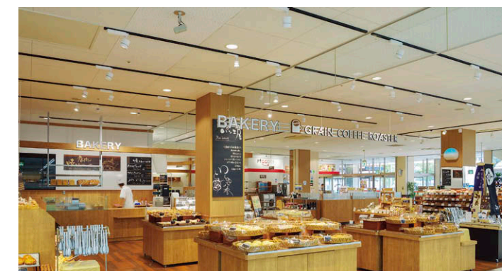
ベーカリー 白塗装のLEDスポットライト③が焼きたてパンの魅力を際立たせ、LEDスポットライト④がサインを浮かせ上げる。