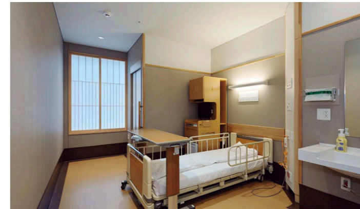
病室(1床室) (上) 間接ベース照明、ベッド灯、常夜灯を兼用したLEDホスピタルブラケット⑥を採用。 病室のベースライト(右) ⑤TENQOO埋込形 40タイプ システムアップ W150 調光(下面カバー付) 3500K