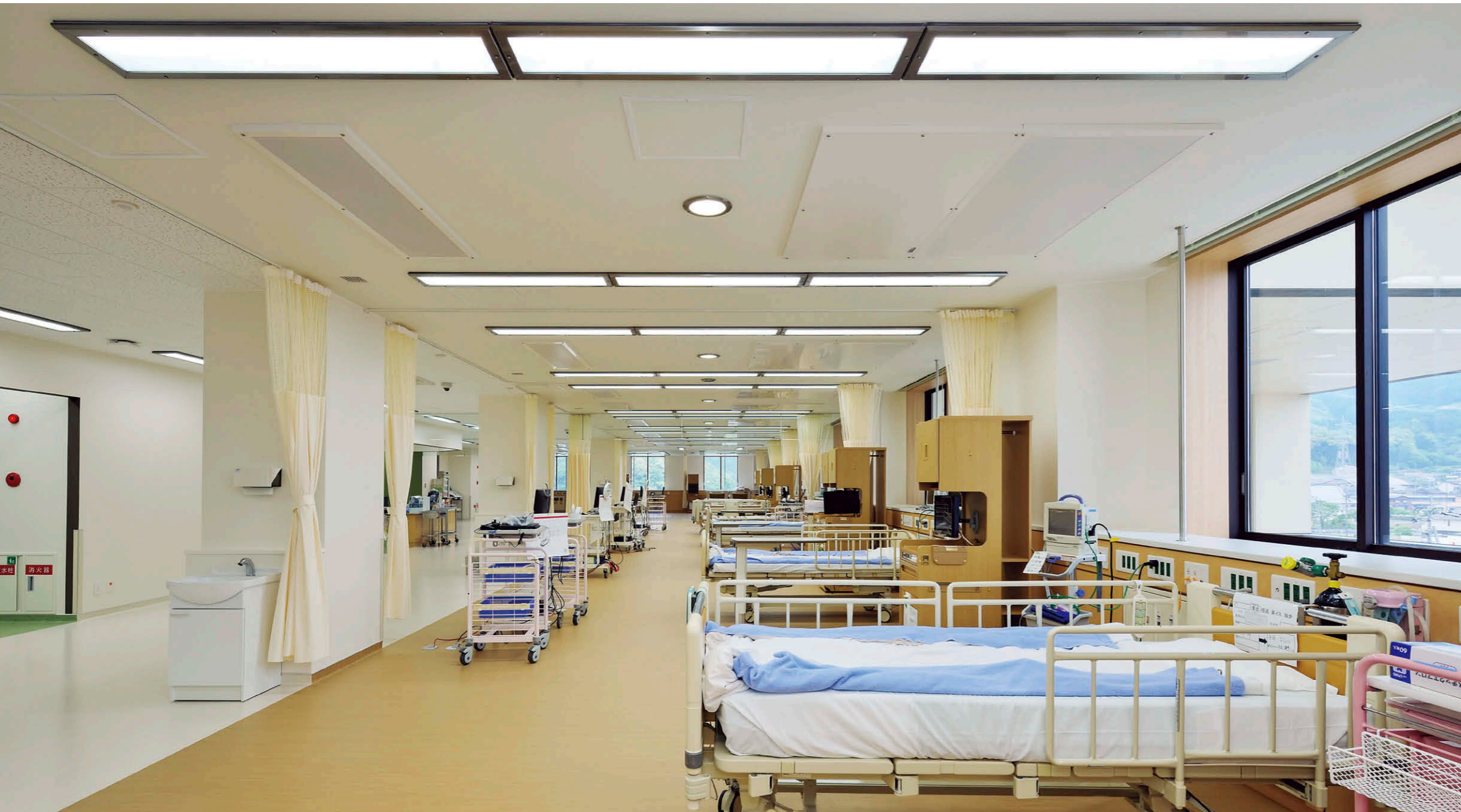
ICU エリア HACCP・クリーンルーム兼用形の TENQOO 埋込形①をベースライトとし、処置灯として LED ユニット交換形ダウンライト②を配置。

【物件概要】 所在地：佐賀県嬉野市嬉野町大字下宿甲 4279-3 建築面積：約 9,900 m 2 延床面積：約 37,600 m 2 構造・規模：鉄骨造(免震構造)・地上 8 階建/塔屋 2 階 施主：独立行政法人国立病院機構嬉野医療センター 設計：(株)佐藤総合計画 施工：建築/松尾建設・堀内組共同企業体 電気/九電工・新生テクノ共同企業体 機械/三建設工業・栄城設備工業共同企業体 オープン：2019年6月