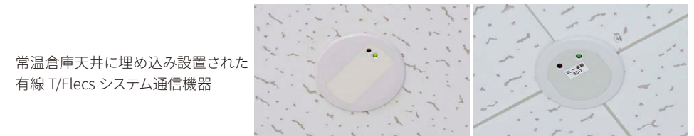
常温倉庫天井に埋め込み設置された有線T/Flecsシステム通信機器