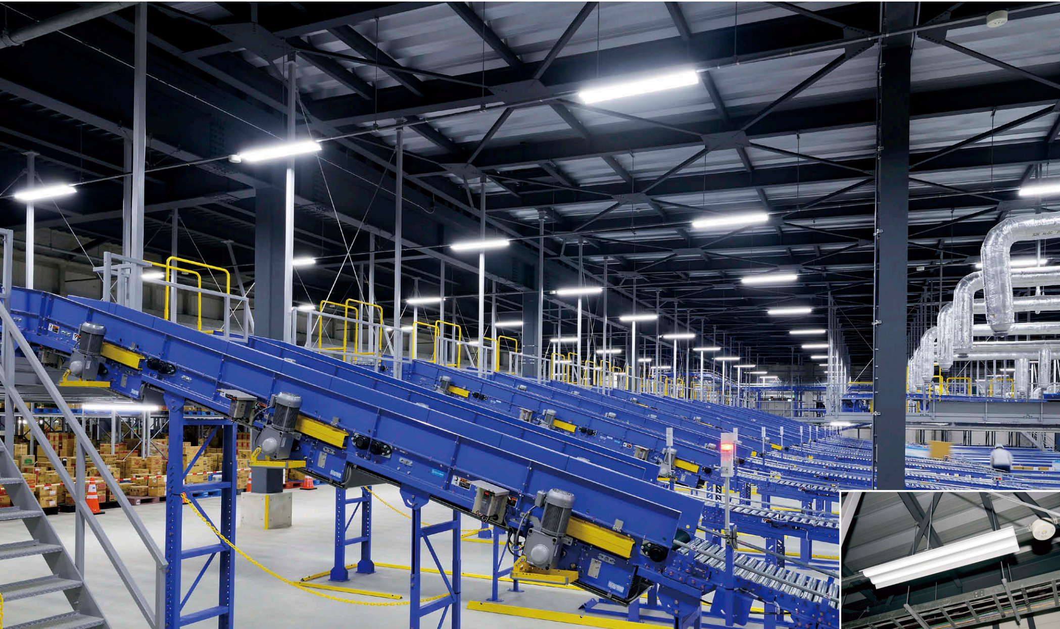
1階常温倉庫の照明 250Wメタルハライドランプ器具に相当する明るさのLEDベースライト①を高さ5.5mのレースウェイに配置し、影が少なく明るい作業環境を創出。

【物件概要】 所在地：沖縄県うるま市勝連南風原 5195-35 敷地面積：44,018 m 2 延床面積：17,653 m 2 構造規模：鉄骨造 地上 2階建 施主：琉球海運(株) 設計：(株)フジター 級建築士事務所 施工：建築／(株)フジタ 電気／(株)きんてん 運営：琉球ロジスティクス(株) 竣工：2019年9月