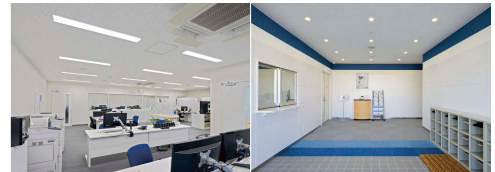
1階配車事務所 5000Kの埋込形LEDベースライト エントランス 白い天井に馴染むLEDダウンライト⑦⑧を採用。