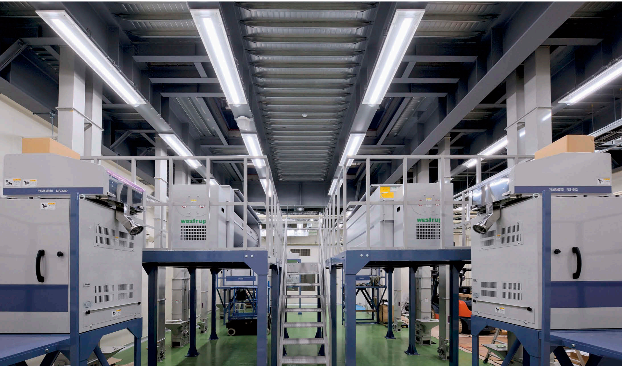
1階精米室 塵が付きにくい下面透明カバー付HACCP対応器具直付形を採用①

【物件概要】 所在地：山形県天童市大字蔵増 1475 番地 10 建築面積：6,407.23 m 2 延床面積：8,130.52 m 2 構造・規模：鉄筋造、3 階建 精米能力：60t/日 施主：(株)ジェイエイトンドウフーズ 設計：全国農業協同組合連合会(全農山形一級建築士事務所)・(株)JA設計 施工：建築/丸七建設・丸吉奥山組 共同企業体 外構/東海林建設(株) 電気/(株)ユアテック 機械/黒澤建設工業(株) 精米プラント/ (株)山本製作所 竣工：2020年3月