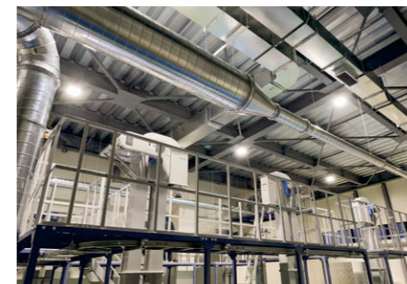
精米・精選室 LED高天井器具軽量タイプ広角形を設置⑤ 出荷室 LED高天井器具キャノピー灯を採用③