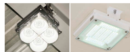
(左) 眩しさを低減したLED高天井器具軽量タイプ⑤ (右) LED高天井器具キャノピー灯③