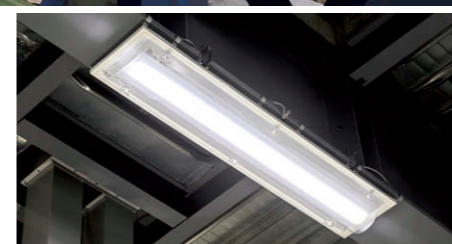
TENQOOシリーズHACCP対応器具②

LED 高天井器具軽量タイプ中角形で効率よく作業面の明るさを確保し、平天井の3階精米・精選室等には、同タイプの明るさムラのない広角形を採用。中角形と広角形とを使い分けて作業の行いやすい照明計画としています。出荷室にはシャッターを開けた際、粉塵や雨を配慮して防塵・防雨及び防虫対応の LED 高天井器具キャノピー灯を設置。管理エリアの休憩室・会議室等は TENQOO シリーズ直付器具及び埋込器具を採用し、玄関ホールや管理通路には LED ユニット交換形ダウンライト＋人感センサーを用いて消エネ化を図っています。