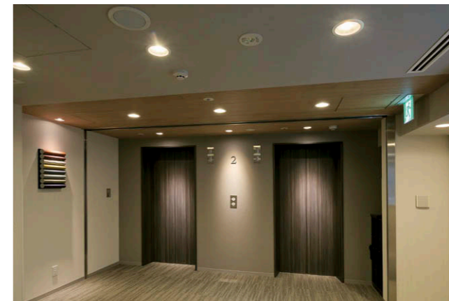
エレベータホールのコントラストをつけた照明演出