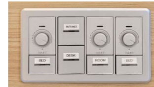
客室内調光器(特注仕様)