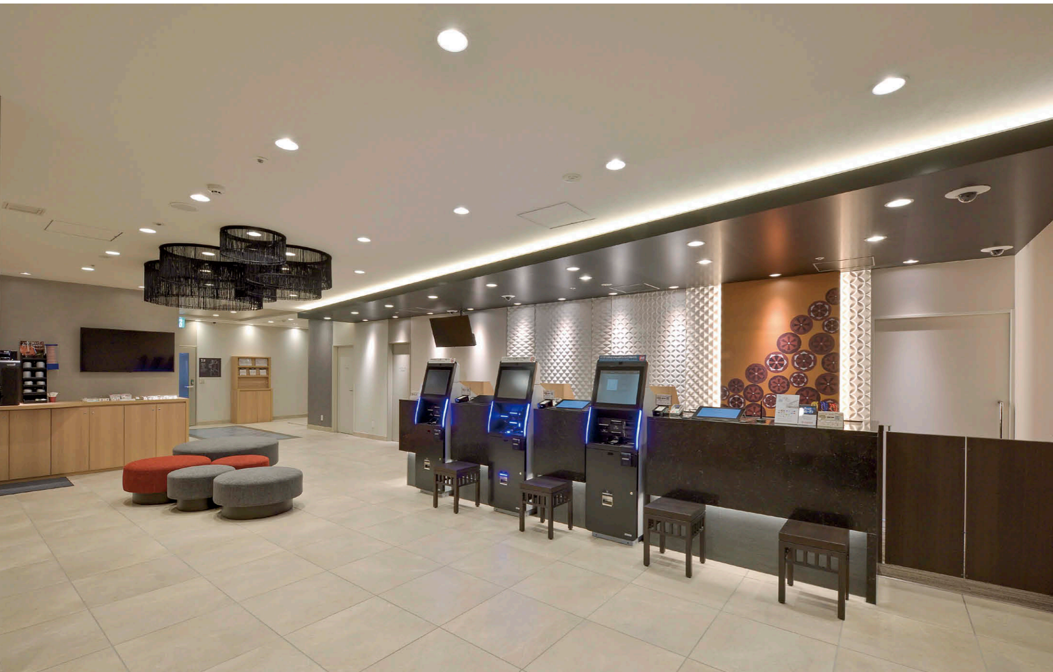
メインホールのLEDユニットフラット形ダウンライト①、TENQOOシリーズ②を中心とした照明

【物件概要】 所在地：愛知県名古屋市中村区名駅4-4-15 敷地面積：5,982.66㎡ 規模：地上18階建/全250室 施主：SMFL 暮らしパートナーズ㈱ 設計：TSUCHIYA ㈱ インテリアデザイン：㈱東急 Re・デザイン 施工：建築/TSUCHIYA ㈱ 電気/衣浦電気工事㈱ 竣工：2020年2月