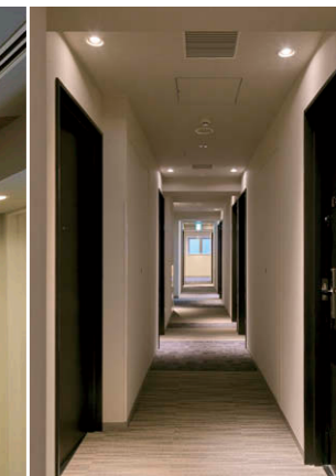
LEDユニバーサルダウンライト②による廊下の照明