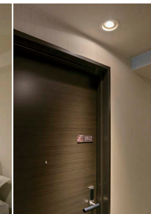
LEDユニバーサルダウンライト②でルームナンバーを照射