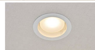
LEDユニットフラット形ダウンライト

を浮かび上がらせるような演出をしました。また天井面にはTENQOOシリーズを間接照明として配しています。エレベータホールはドア中心の階数表示、オブジェを際立たせるように中角タイプのダウンライトで光を丸く当てています。客室ドアはLEDユニバーサルダウンライトでルームナンバーを浮かび上げ、室内は好みに合わせた調光が可能です。このほかバックヤードにはTENQOOシリーズを採用しています。