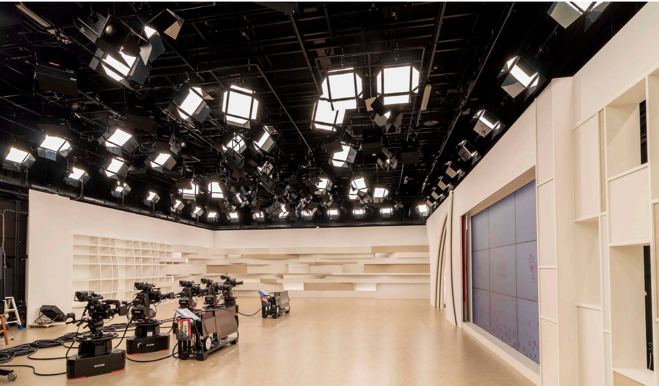
Cスタジオ LEDブロードライト①は、バンドアの開閉により光量調整が可能。

【物件概要】 所在地：東京都江東区東陽7丁目2番18号 スタジオ面積（A・B・C・Pスタジオ）：各315㎡ パトン高さ：約5.0m セットの高さ：3.6m 施主：ジュピターショップチャンネル(株) 施工：建築/鹿島建設(株) スタジオ照明設備及び昇降設備/東芝ライテック(株) 番組放送開始：2021年2月