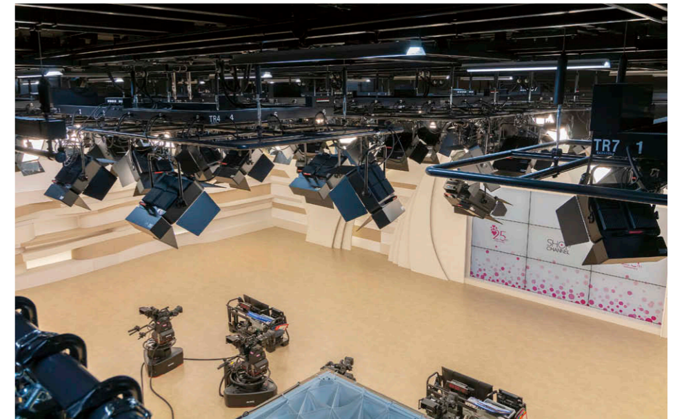
Cスタジオ（キャットウォークより望む）LEDブロードライト①、LEDスポットライト②③を、サイズの異なる4種類のトラスパトン⑤と外周パトン⑥に緻密に配置し、各セットを効果的にライティング。

にも優れた、平均演色評価数 Ra95、相関色温度 3000K（電球色相当）の器具を採用。なかでもLEDブロードライトは、光を集約できるようなバンドア内面を鏡面仕様としています。また、特注仕様とした調光操作卓、ワイヤレスタブレット操作器等の照明設備や照明パトン、操作盤等の昇降設備もA、B、Cスタジオで同一仕様とすることで、24時間の放送にも対応できる使い勝手の良い照明環境を創出しています。