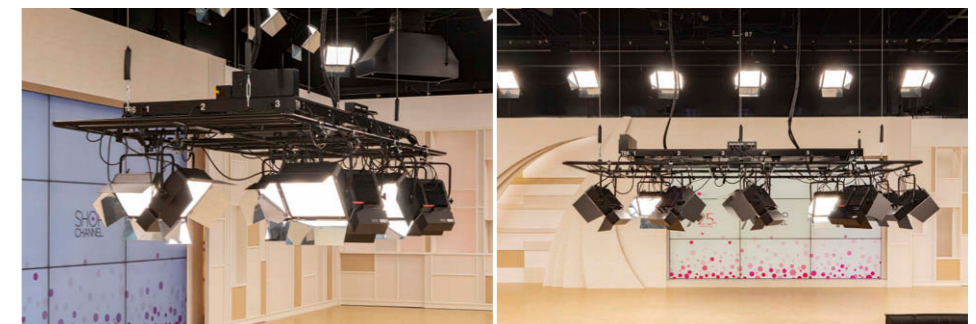
照明トラスパトン セットに合わせて効率的なセッティングが可能な全32掛の特注トラスパトン⑤を納入。双方向通信RDMによりLEDブロードライト①、LEDスポットライト②③などの照明器具を自動認識。