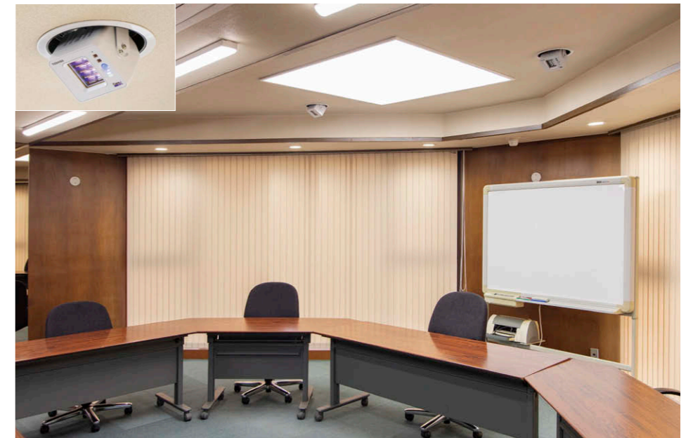
役員会議室を出入口側から奥を望む UVee①の設置で長時間の会議でも安心して使用可能。