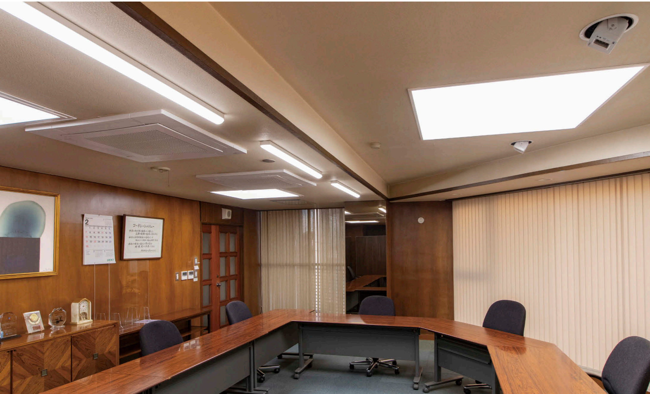
3階の役員会議室をガラス窓側から出入口側を望む UVeeを2台①設置して室内を除菌。クリーンな空間を確保。

【物件概要】 所在地：東京都大田区久が原5-33-10 建築面積：392㎡ 延床面積：1,528㎡ 施主：(株)ウエキコーポレーション 設計：電気/機インターフェースプロダクツ 竣工：2021年2月