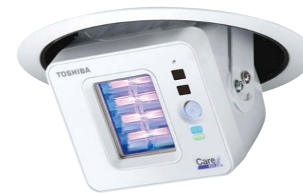
UVee埋込ユニバーサルダウンライト①

3階の約50㎡ある役員会議室には、UVeeユニバーサルダウンライトを2.3mの天井高に窓ガラスから1m離して2台（器具間隔2.2m）を首振り角度45度にして設置。会議室は、長時間使用することもあり、UVeeでの有人環境下で室内空間全体のウイルスを抑制・除菌の実現により、クリーンな空間で安心して会議を行える効果が得られています。