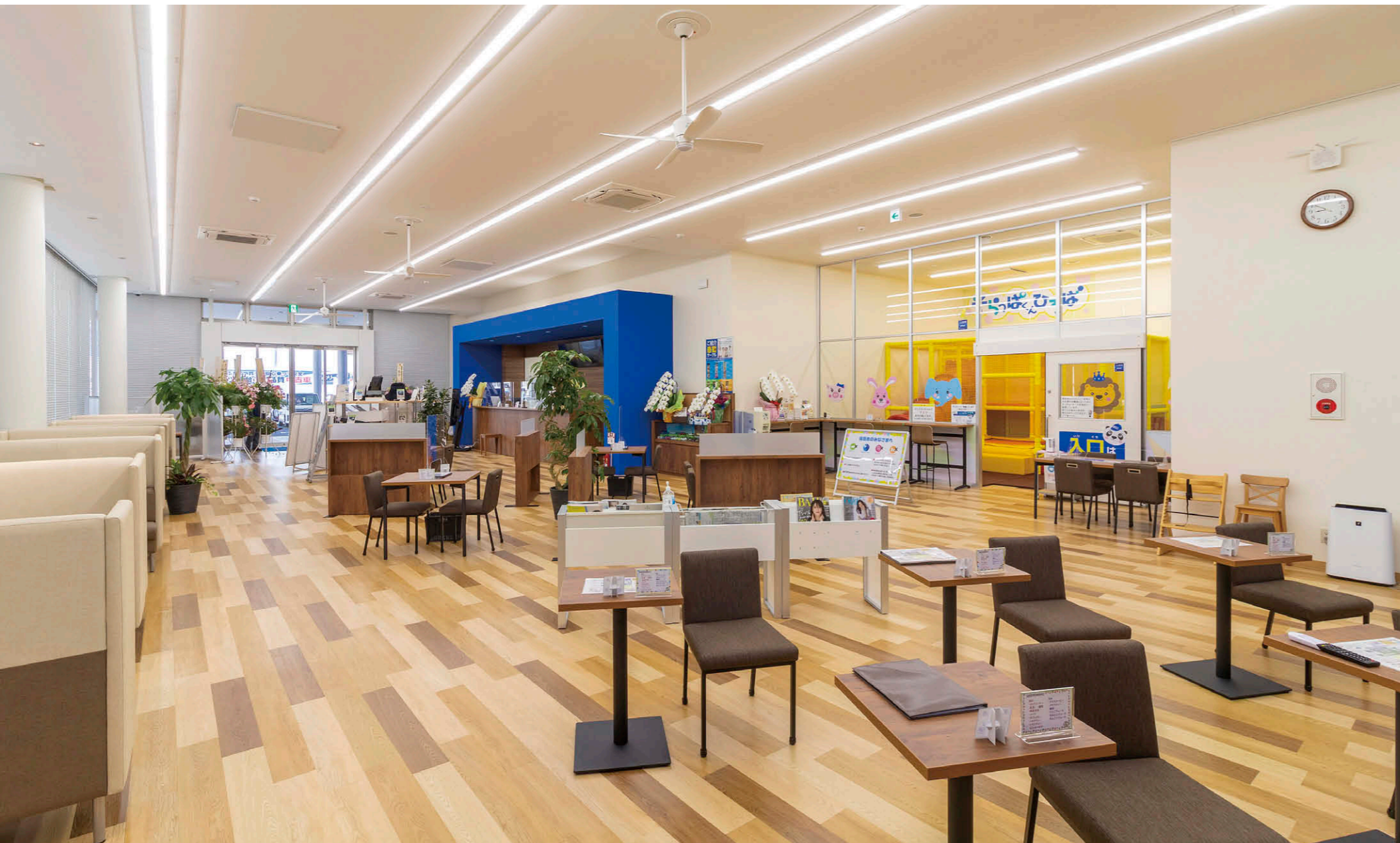
商談スペース 展示車両はピロティ、店頭に配置し、室内は商談スペースに特化。TENQOOシリーズ40タイプ直付形①を連結配置。

【物件概要】 所在地：宮城県仙台市青葉区北根二丁目 8-15 敷地面積：3,486.92 m 2 建築面積：1,623.06 m 2 延床面積：1,749.70 m 2 施主：ネットトヨタ仙台(株) 設計：(株)三協技術 施工：建築/石野建設(株) 電気/福興電気(株) 竣工：2021年6月