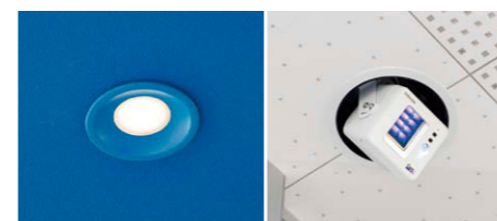
(左) LEDユニット交換形ダウンライト④ (右) ウイルス抑制・除菌用照射器UVee⑤