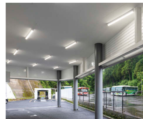
工場裏ピロティ 防湿・防水タイプのTENQOOシリーズ③を使用。