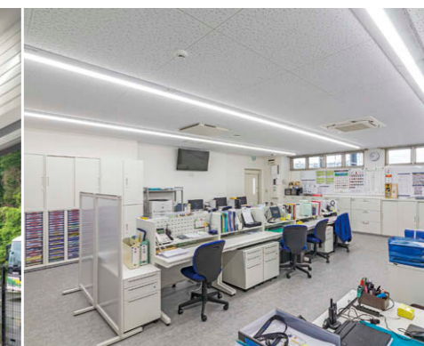
バックヤード TENQOOシリーズ40タイプ直付形①による照明。