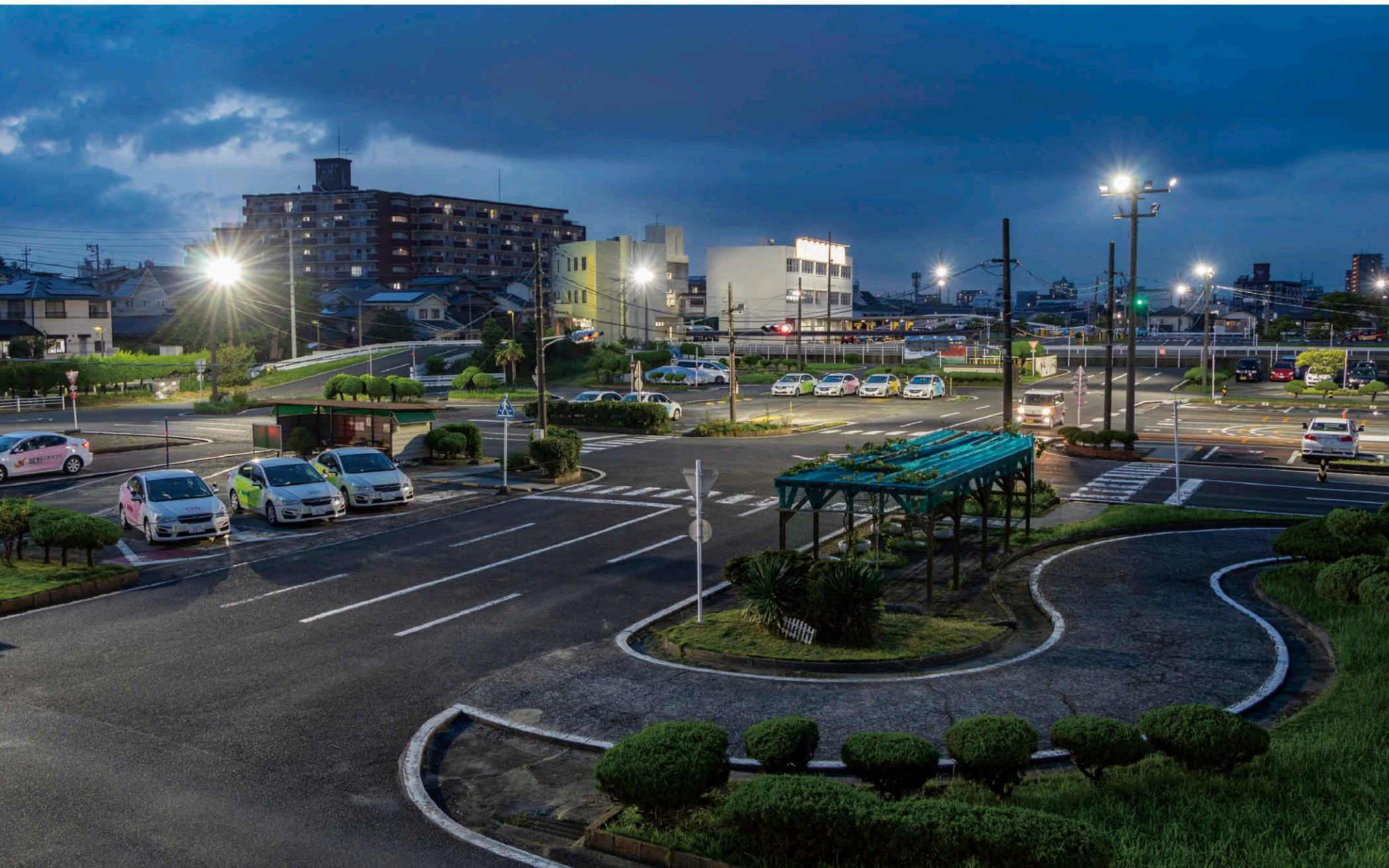
教習コース全景 事務棟 2 階の高さからコース全体を望む。LED 投光器①②で照度アップを実現。

【物件概要】 所在地：福岡県北九州市小倉区霧ヶ丘 1-15-1 敷地面積：20,003 m 2 教習コース面積：14,277 m 2 施主：(株)城野自動車学校 設計：野中武次（初代理事長） 照明更新施工：(株)プラスコクア 照明更新完成：2021 年 6 月