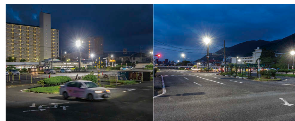
コース右奥から事務棟方向を望む。