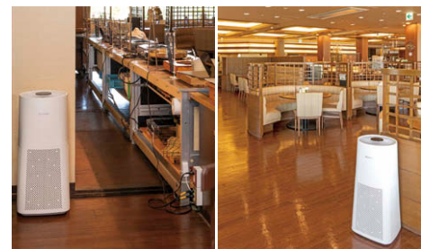
店内空気を UV-C 室内空気除菌機①により除菌。