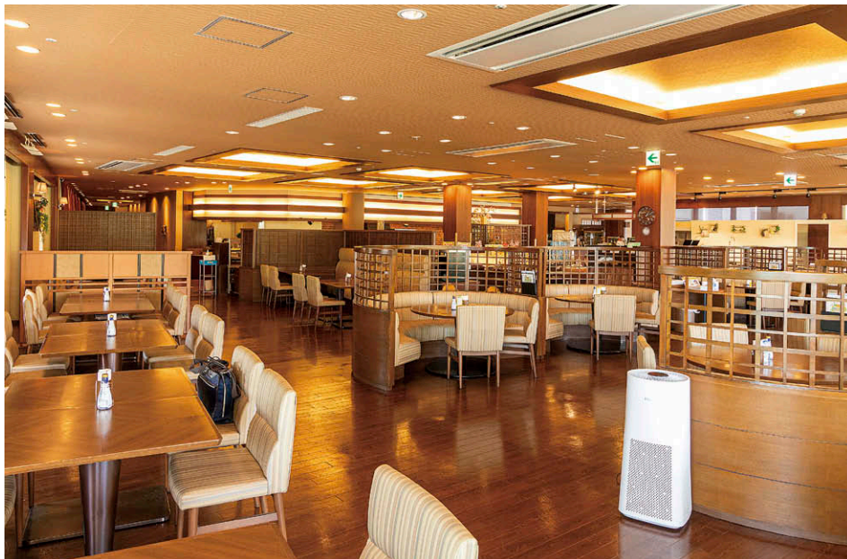
「るびなす」の店内に設置された UV-C 室内空気除菌機①

という報告を共有。食事にあたりマスクを外す時間が長くなるダイニングにおける、空間滅菌の追加対策として同機の導入を決定しました。UV-C 室内空気除菌機は 1 台で 80 m 2 の部屋において 2 時間運転すると 98% 以上の除菌率を実現します。ホテルウェルシーズン浜名湖では、二つのダイニング合わせて 880 m 2 の空間に、できるだけ均等の間隔を取って本機を 10 台設置。使いやすい操作で稼働時間設定も簡単。メンテナンス性に優れた高い除菌性能を発揮しています。