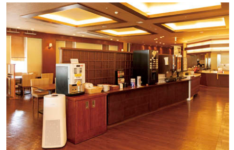
ドリンクバーコーナー脇の UV-C 室内空気除菌機①