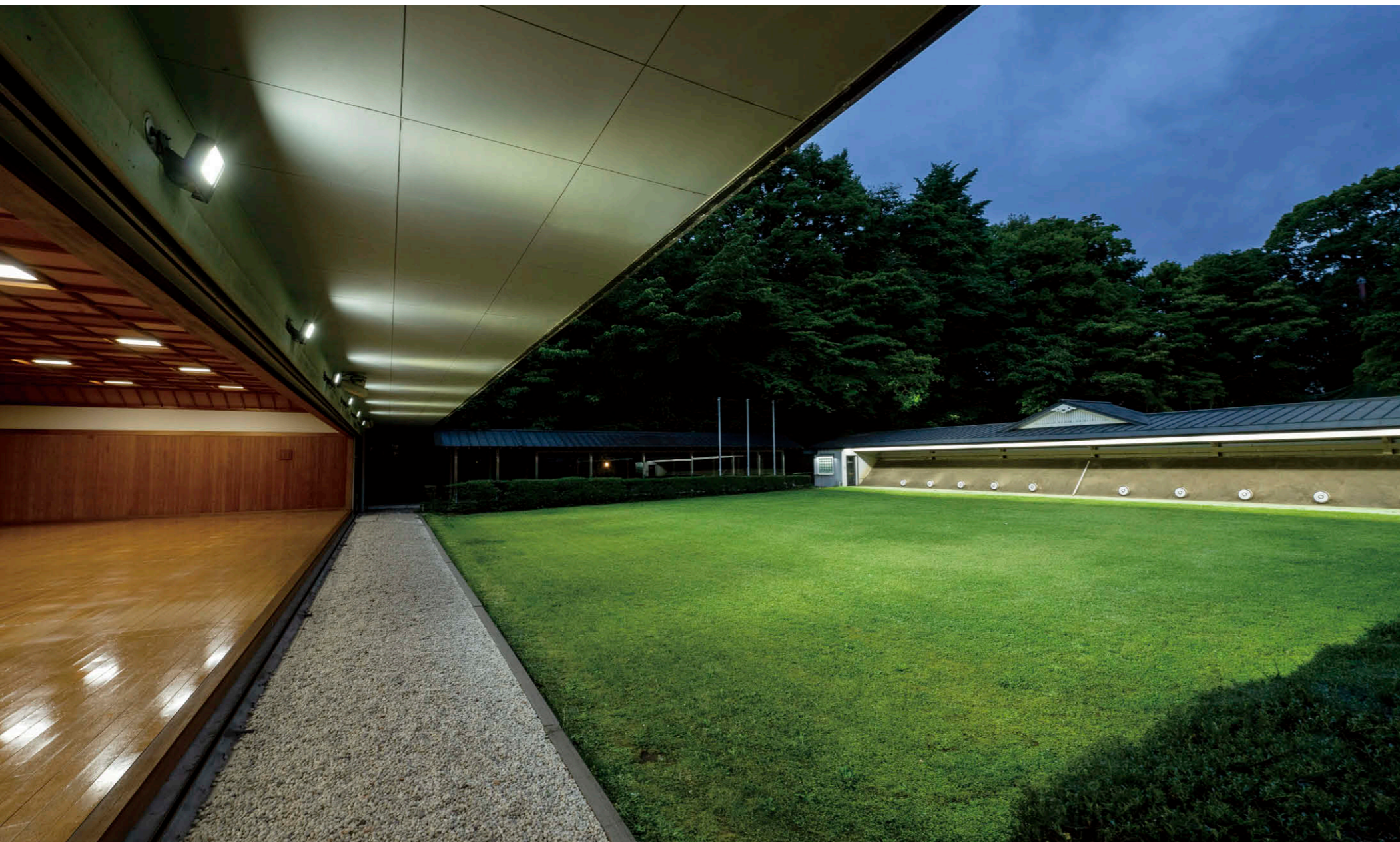
射場側から矢道を望む 射場の底の下に 150W 形コンパクトメタルハライドランプ器具相当の LED 小形角形投光器③広角タイプを配置し矢道の光ムラを解消。

【物件概要】 所在地：東京都渋谷区代々木神園町 1-1 地番 1728 建築面積：1,923.79 m 2 延床面積：2,745.26 m 2 構造・規模：鉄骨鉄筋コンクリート造一部鉄骨造・2階建 施主：明治神宮・公益財団法人全日本弓道連盟 施工：電気/エルティール(株) 竣工：2022年3月