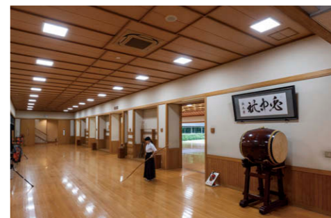
選手控室 和風乳白パネル□450 の TENQOO スクエア⑤を採用し、心を鎮める光空間を創出。