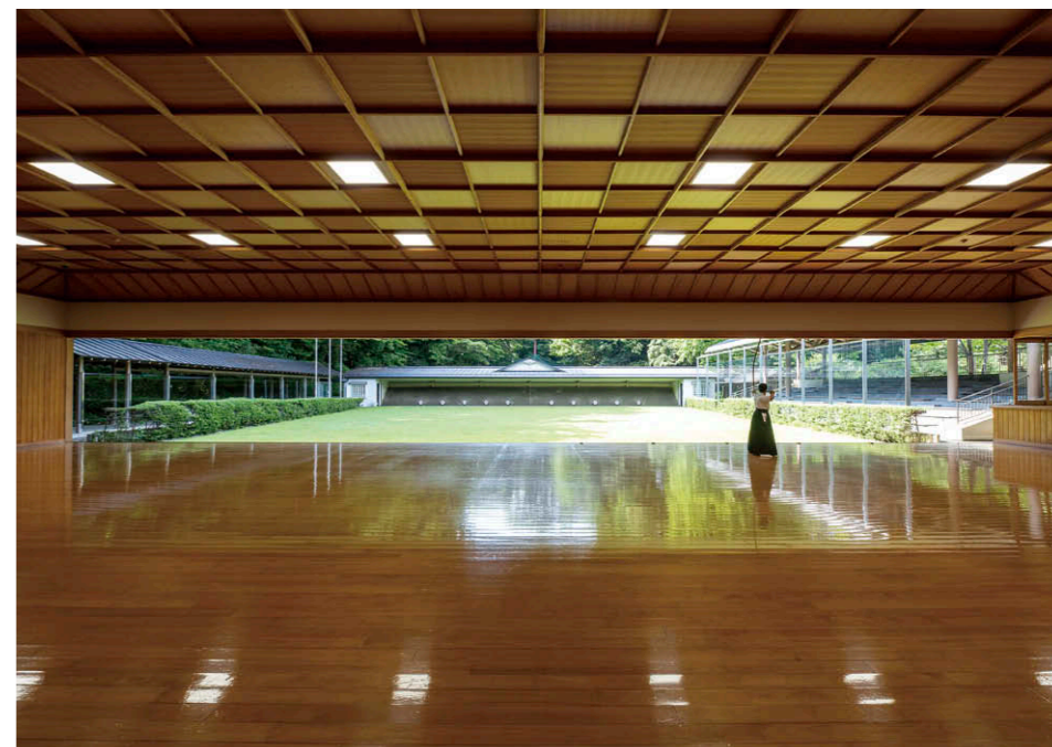
射場側からの場側を望む 射場には LED ベースライト TENQOO スクエア□600 和風乳白パネル④を採用。