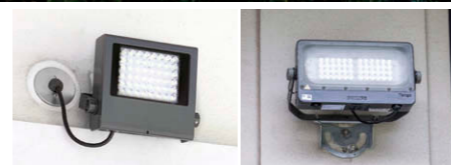
(左) LED小形角形投光器150W形コンパクトメタルハライドランプ器具相当③(右) LED小形投光器 250W形メタルハライドランプ器具相当①