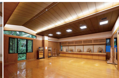
巻藁射場 TENQOO スクエア和風格子パネル⑥を採用し間接照明には TENQOO シリーズ⑦を使用。