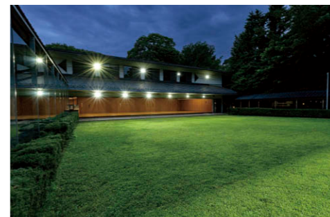
近的的場側から射場を望む 2階壁面に LED 小形投光器①②、射場底下に LED 小形角形投光器③を配置。

矢道の全体的な光ムラ解消を目的として射場底下に配置されていた 150W 形メタルハライドランプ投光器は、150W 形コンパクトメタルハライドランプ器具相当の LED 小形角形投光器に更新。射場の底の上部、建物 2 階壁面の 400W 形メタルハライドランプ投光器は、250W 形メタルハライドランプ器具相当 (400W 形水銀ランプ器具相当) の LED 小型投光器に更新し、近的用の広角タイプ 3 台、遠的用の狭角タイプ 2 台に置換え。さらに矢道の両サイドに設置された照明塔では、遠的用のメタルハライドランプ投光器左右 3 台ずつ計 6 台を LED 投光器に更新しています。