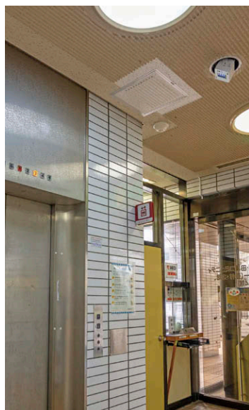
エレベーターホール エレベーターのボタンを狙って照射。