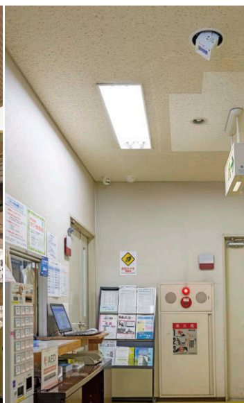
コミュニティセンター受付 受付まわりのウイルス抑制・除菌。