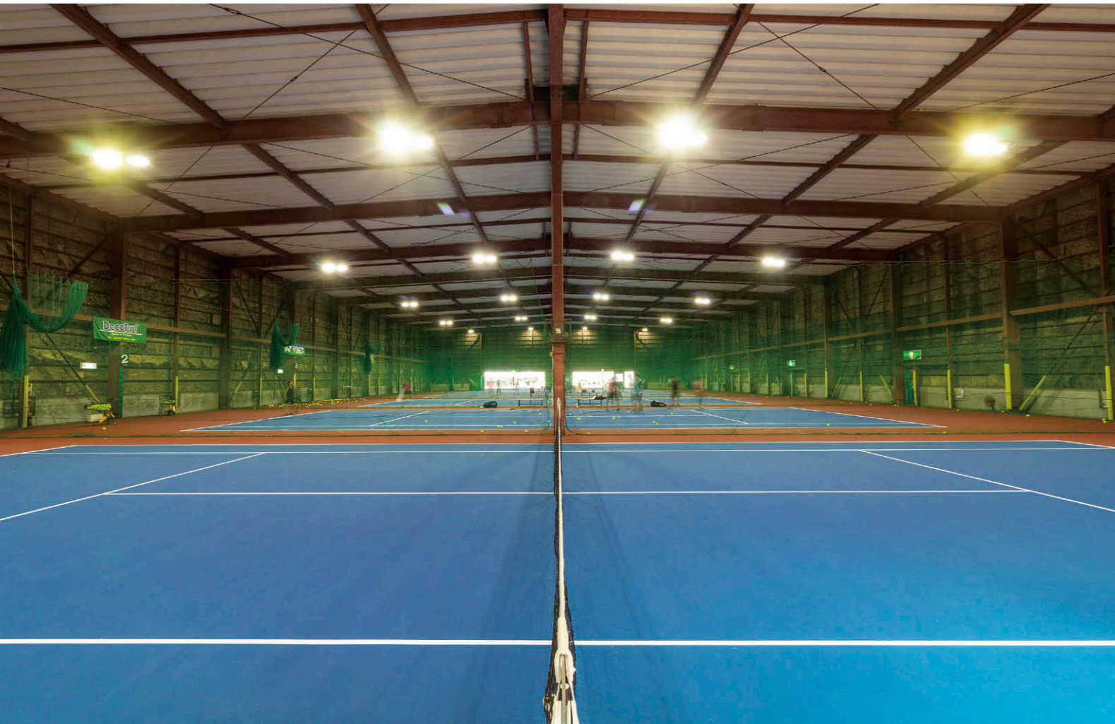
入口からテニスコート5面を望む LED投光器①で明るく均一な照明の運動環境を実現。

【物件概要】 所在地：千葉県千葉市美浜区新港 32-4 敷地面積：2,500㎡ コート面積：1,500㎡ 規模・構造：鉄骨造 施主：(株)テニスガーデン 施工：新日本建販(株) リニューアル完成：2022年3月