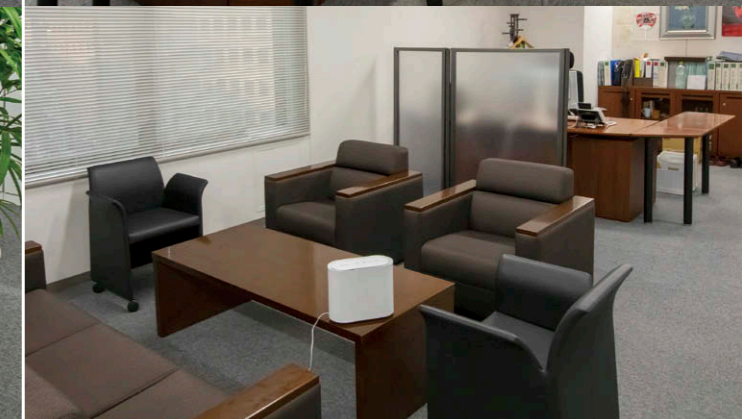
社長室 状況に応じてUVish卓上タイプ②を移動して稼働。