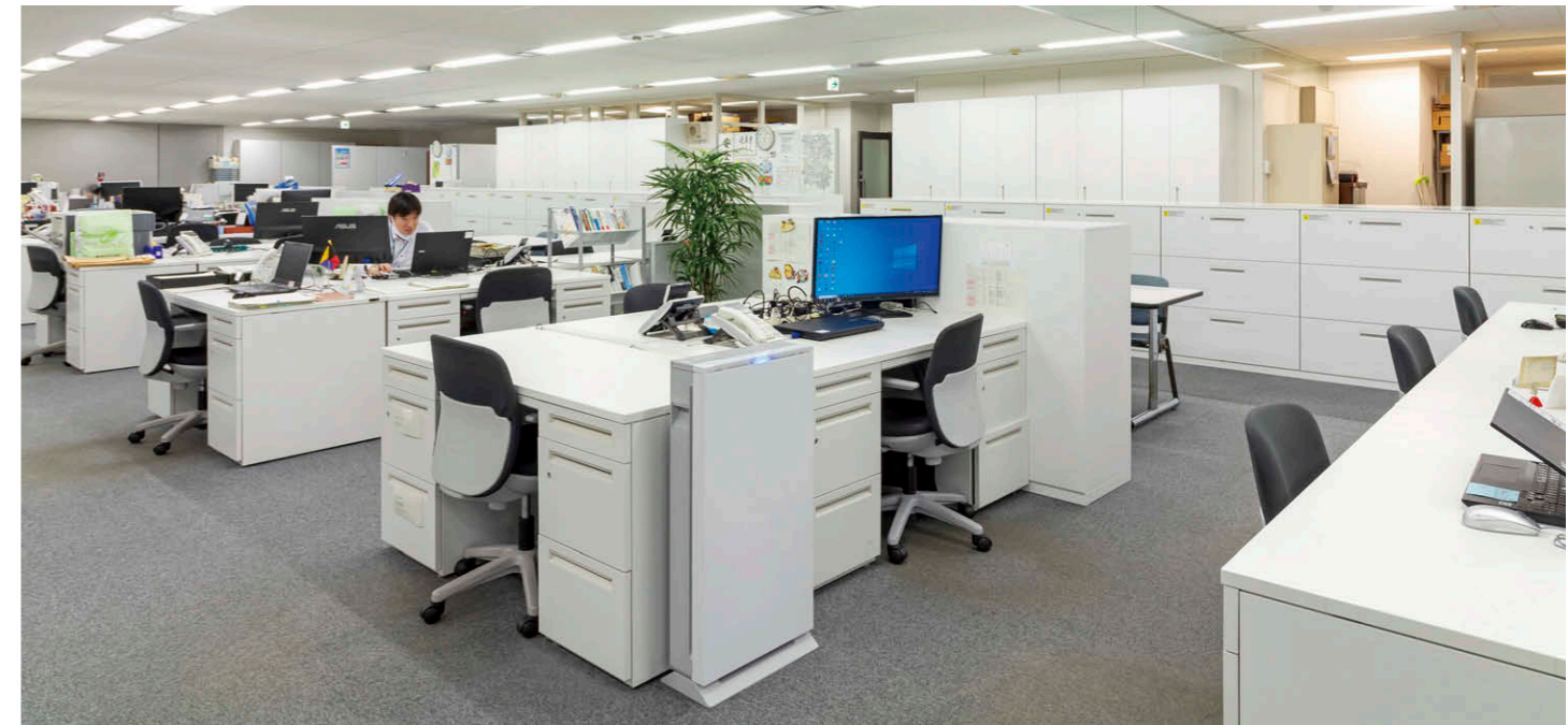
本社(5階フロア) ウイルス抑制、除菌、脱臭効果で執務空間の空気をクリーン化。

13拠点に27台のUVishを導入しました。本社・東日本事業部においては2フロアあるオフィスに各5台ずつ据置タイプ100を設置。近くの社員が出社時にスイッチを入れ、8時間タイマーを用いて稼働させています。また大切なゲストを迎えるの打ち合わせなども多い社長室には、より持ち運びが容易な卓上タイプを採用。来客時、デスクワーク時など臨機応変に設置場所を変えて稼働しています。全社的なUVish導入により、常にクリーンな空間で安心して執務できる環境を創り出し、ES(従業員満足度)向上にも貢献しています。