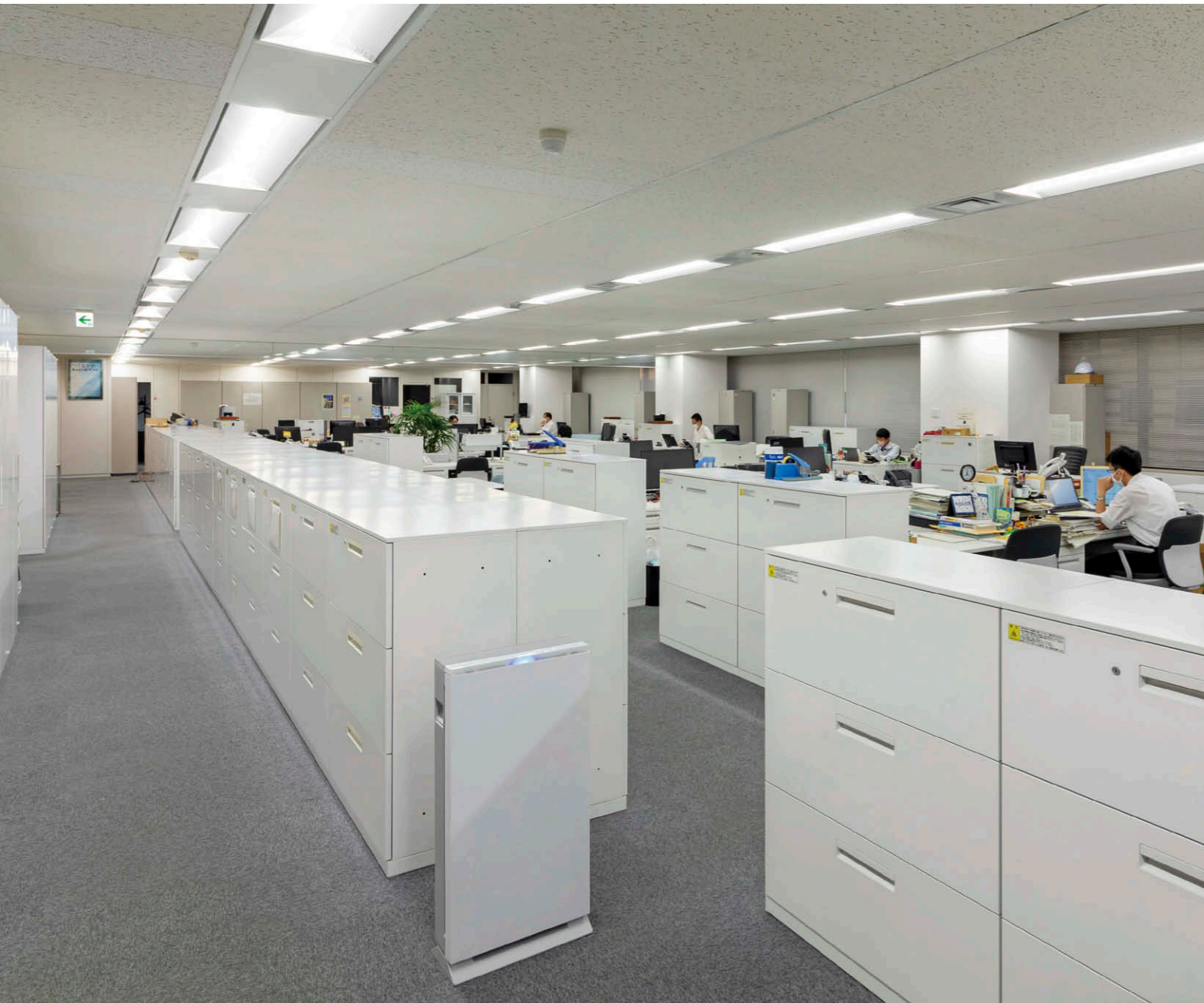
本社(5階フロア) 執務、動線の妨げにならない場所にUVish据置タイプ100①を設置。

【物件概要】 所在地：本社／東京都中央区新川1-16-3 住友不動産茅場町ビル 事業所：全国13拠点 フロア面積：1,638㎡(本社・東日本事業部／2フロア) 従業員数：本社84名(全社／288名) 施工：オーク設備工業(株) 導入時期：2023年1月