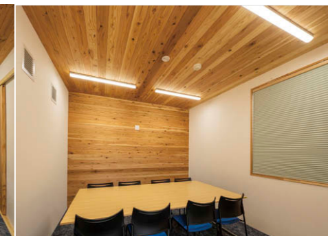
小会議室 スペースに合わせてLEDベースライトTENQOOシリーズ⑤を配置。