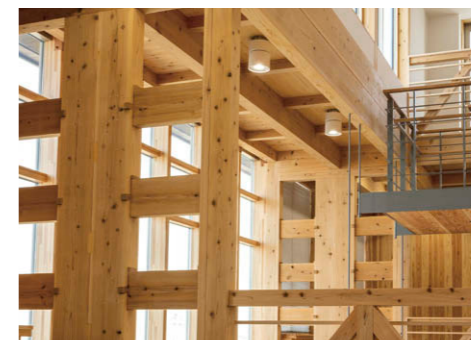
吹抜(2階) 昼光が入る吹抜の高天井部分にはLEDシーリングダウンライト②を採用。