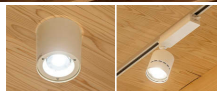
LEDシーリングダウンライト②