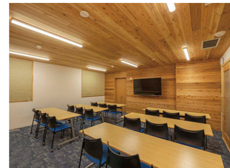
会議室 省エネ性能の高さと天井への直付が可能な点でLEDベースライトTENQOOシリーズ④を採用。