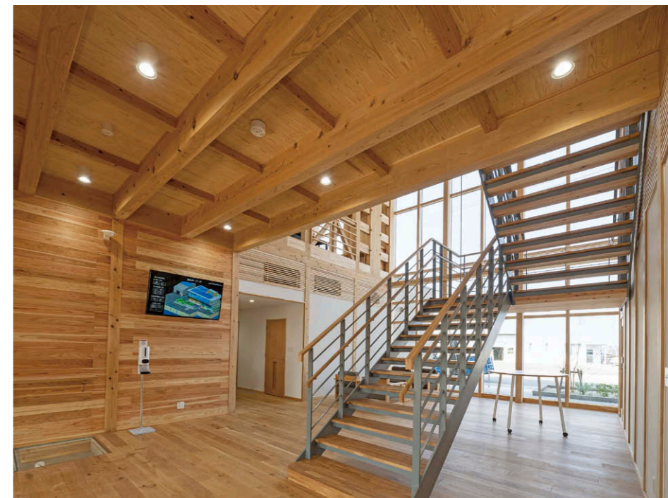
エントランスホール(1階) 天井の低い空間にはLEDユニット交換形ダウンライト直付シーリング①を採用。

なため、天井の高い窓際に5,525lmのLEDシーリングダウンライトを採用し、天井の低い空間には2,370lmのLEDユニット交換形ダウンライト2500シリーズを採用。高効率タイプの2種類の器具を併用することで消費電力を削減しています。また、2階中央の共有スペースでは、ライティングレールを用いてLED一体形スポットライトの超広角タイプを配置。状況に合わせてフレキシブルな照明環境を得られる設計としています。会議室では、器具の省エネ性能の高さと、器具自体の配置数量を少なく抑えられる点でLEDベースライトTENQOOシリーズを採用しています。