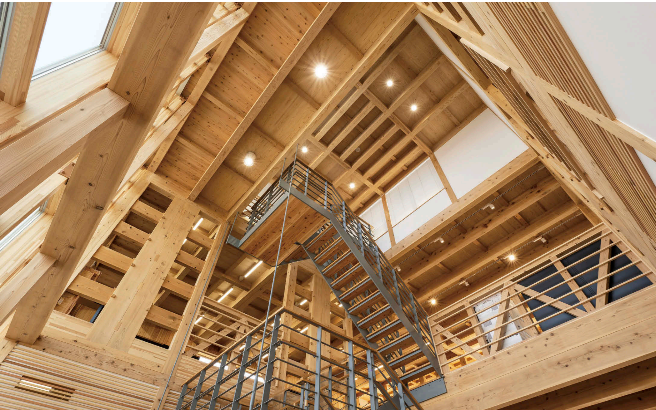
エントランスホール(吹抜) LEDユニット交換形ダウンライト①とLEDシーリングダウンライト②を併用し消費電力を削減。

【物件概要】 所在地：宮城県仙台市若林区六丁目字南12 (仙台市六丁目の目元町・六丁目土地区画整理事業 地内) 延床面積：964.15㎡(全体) 構造・規模：木造2階建 床面積677.00㎡(事務所棟のみ) 施主：東北ボーリング㈱ 設計：(株)ササキ設計 施工：建築/㈱サンホーム 機械設備・電気設備/エルゴテック㈱ 竣工：2023年2月