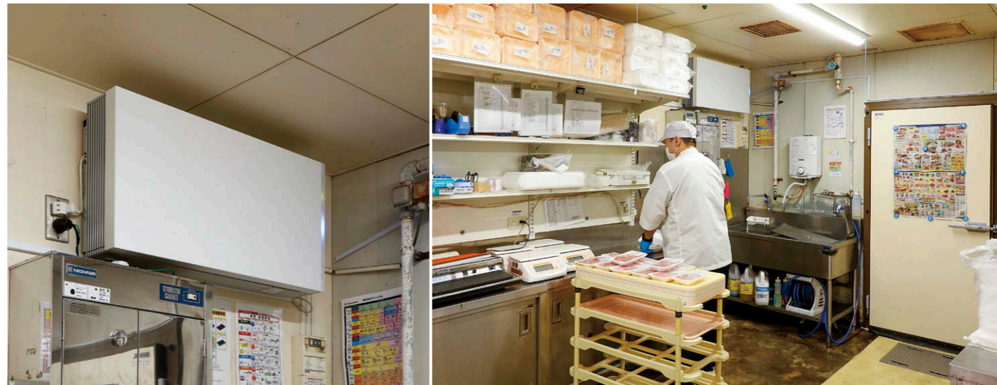
高幡店で4台のUVish壁掛タイプ①を導入。