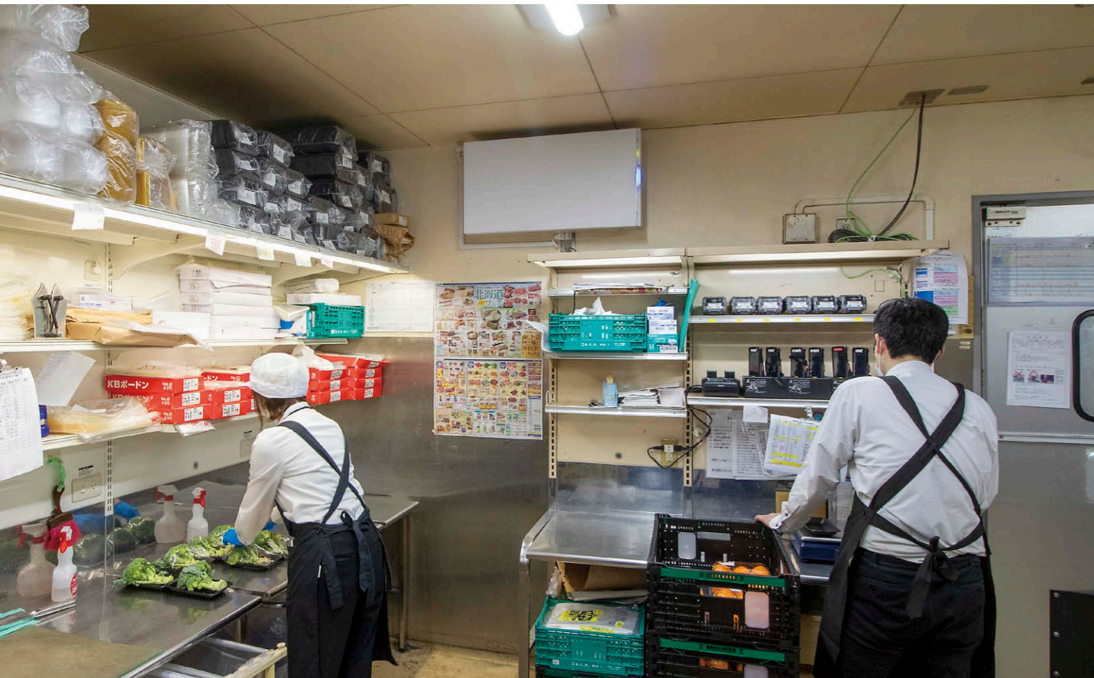
青果厨房 UVish壁掛タイプ①

【物件概要】 所在地(本社): 東京都多摩市関戸1-7-4 高幡店所在地: 東京都日野市高幡116-10 高幡店バックヤード延床面積: 780㎡ 施主: ㈱京王ストア 導入: 2023年3月