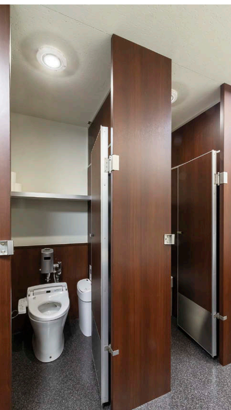
トイレ(個室) UVish天井埋込タイプ①を採用し、狭い空間でも照明と除菌・脱臭を両立。