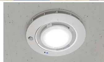
UVish天井埋込タイプ 除菌・脱臭ユニット(照明付)人感センサー内蔵形①

が内装フルリフォームを実施し、UVish天井埋込タイプ除菌・脱臭ユニット(照明付)を導入。UV-LED光触媒装置の機能と、24形コンパクト蛍光灯器具相当となる約1,000lmの明るさ、色温度5000KのLEDダウンライトが一体となったUVish天井埋込タイプにより、すっきりとした空間とウイルス抑制・除菌脱臭を両立させています。照明は、人感センサーにより人が近づくと点灯し1分後に消灯する設定。除菌・脱臭は、同じく人感センサーで稼働し、UVと光触媒により1台あたり10㎡で90%の除菌が可能な3時間後にファンを自動停止する設定で運用しています。