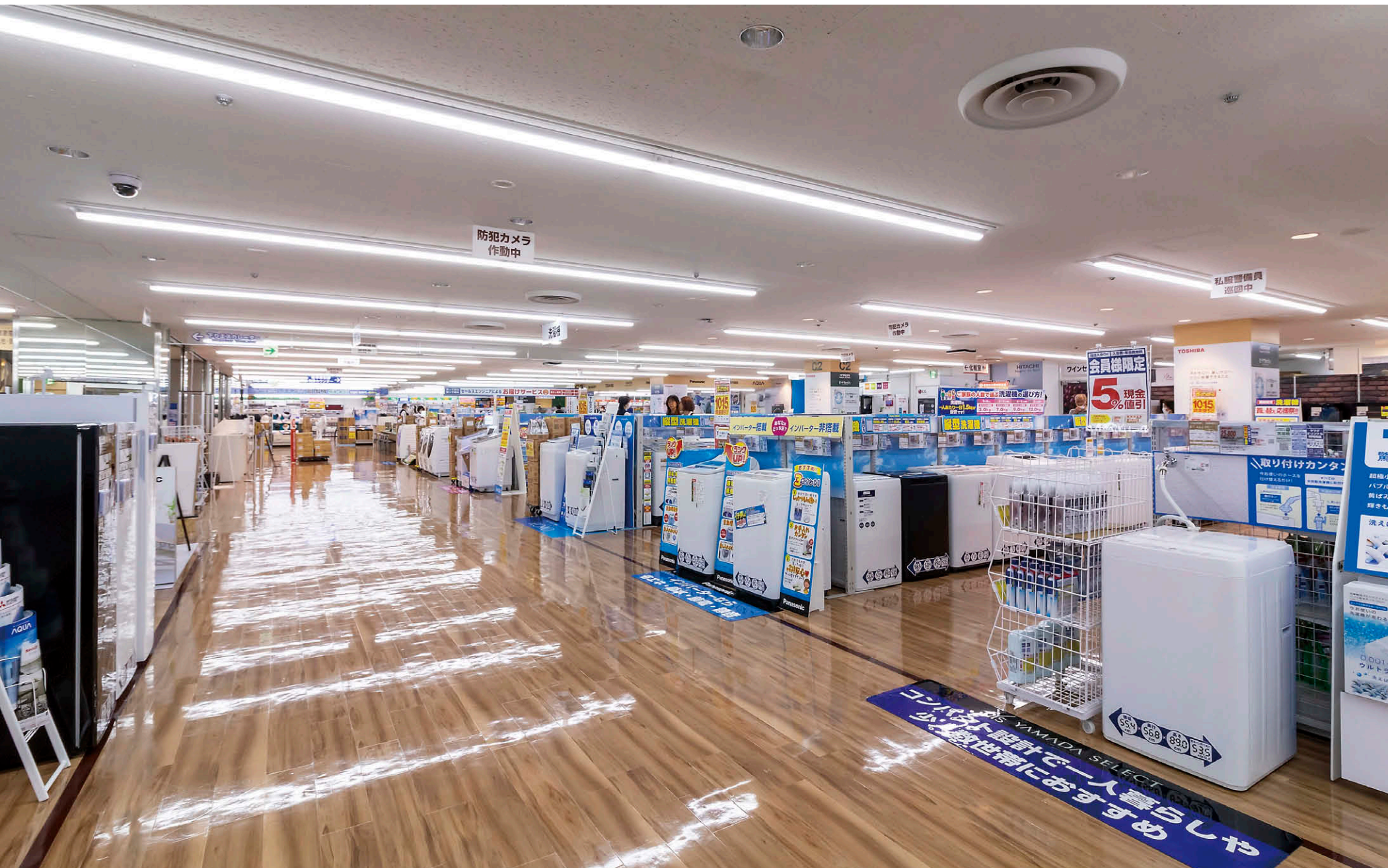
売場(7階) 広いスペースではTENQOOシリーズ②を連結配置し、売場空間に明るく活気のある光環境を創出。

【物件概要】 所在地：神奈川県藤沢市藤沢555さいか屋藤沢店4F~7F 売場面積：約10,000㎡ 施主：さいか屋 藤沢店/関さいか屋グループ （株）サンパール藤沢 LABI藤沢/関ヤマダホールディングス 施工：電気/1st SERVICE (株) オープン：2023年6月