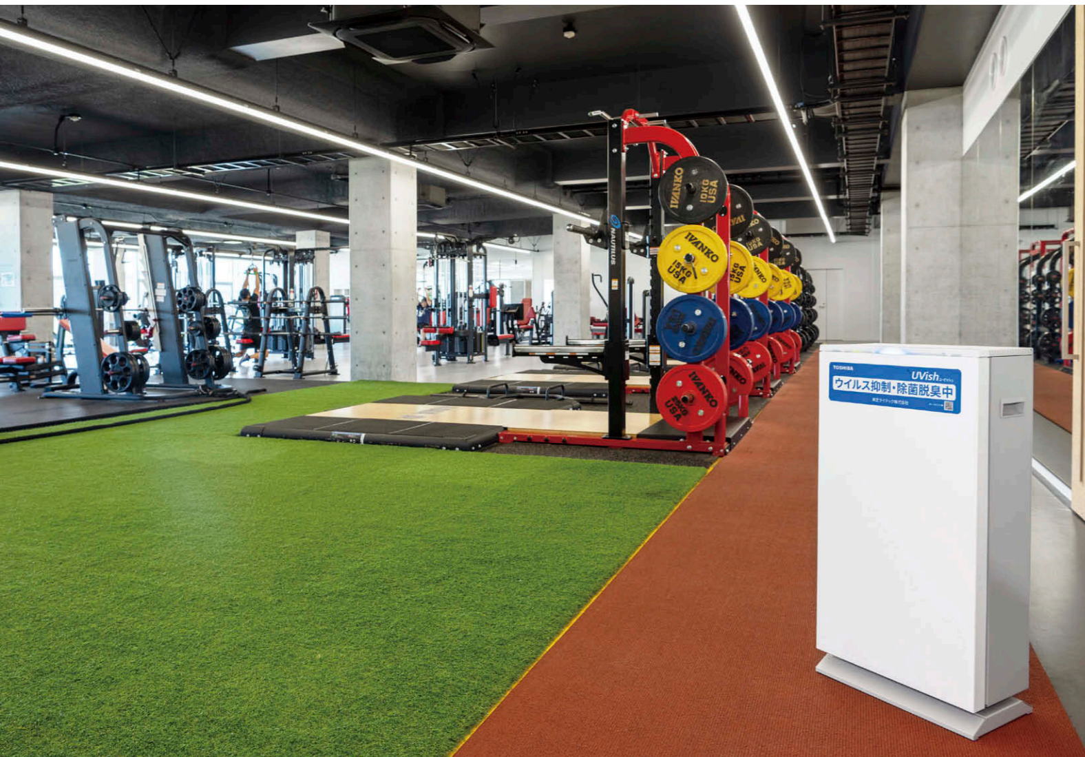
ASIA SPORTS CENTERトレーニングセンター 他のスポーツ部や一般利用でも使用可能なトレーニングセンターに4台のUVishを設置。

【物件概要】 所在地：東京都西多摩郡日の出町平井1449-1 構造・規模：RC造・3階建(日の出寮) 延床面積：2,752.32㎡ 竣工：2021年4月 UVish導入：2022年11月