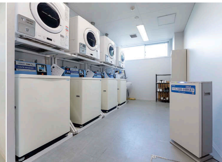
ランドリー前 ロッカーと風呂場の間に位置する洗濯機前にも設置。