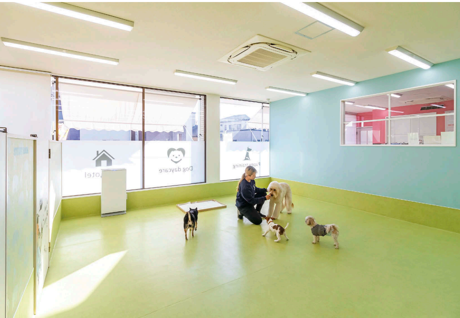
トレーニングルームに設置されたUVish据置タイプ200。

【物件概要】 所在地：埼玉県上尾市南90-1 構造規模：鉄骨造、平屋建 延床面積：150㎡ スタッフ数：7名 施主：ZUTTO DOG 導入：2023年11月