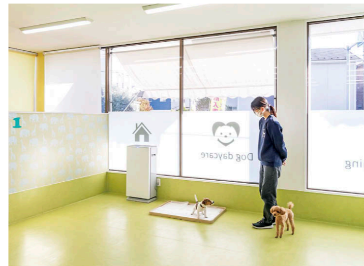
排泄場所の側にUVish据置タイプ200を設置。