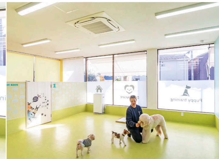
個性や性格に合わせたプログラムを提供。