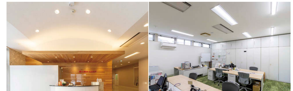
エントランスの照明 曲面天井部には傾斜天井用のLEDダウンライト④を10台採用。 執務室の照明 新たに追加した6,900lmタイプのLEDベースライト⑤により照度アップを実現。