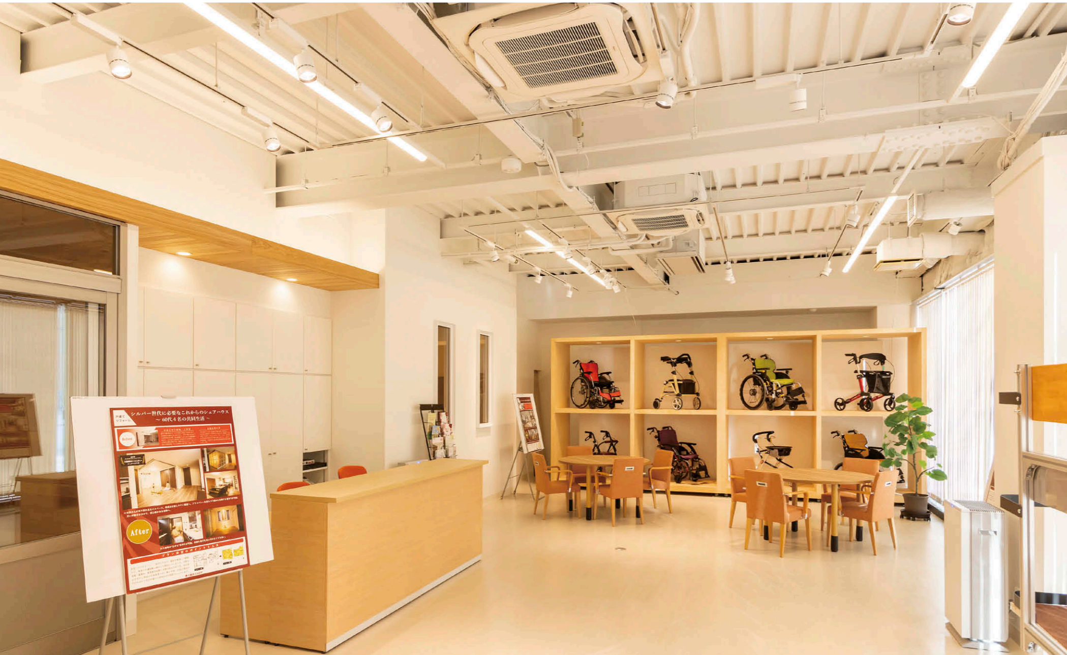
ショールームの照明 高さ3.9mのスケルトン天井にライティングレールを設置し、33台のLEDスポットライト広角タイプ①を配置。さらに12台のLEDベースライト②も高さ3.5mのレースウェイに取り付け、照明器具の散在感のない、柔らかな光が広がる空間を演出。

【物件概要】 所在地：札幌市厚別区厚別南1-18-1 構造・規模：鉄筋コンクリート造、地上4階建 リニューアル面積：約252㎡ 施主：(株)土屋ホームトピア 設計・施工：電気/(株)エコテック リニューアル完成：2024年11月