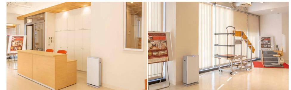
ショールームの除菌風景 UVishの据置タイプ100⑥と据置タイプ200⑦を各1台ずつ設置し、ウイルス感染のリスクを軽減。脱臭機能によりニオイのない空間を創出。