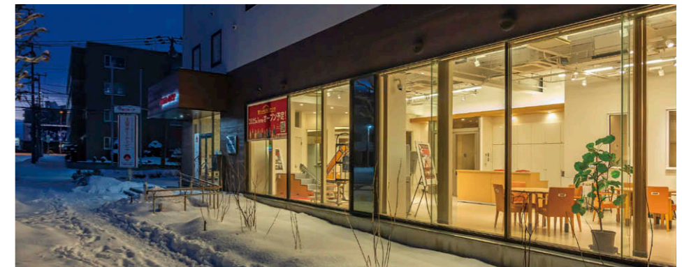
夜間点灯の様子 人やクルマの通行が多い立地なので、事業PRの一環として17時の閉店後もショールーム内の照明を22時まで点灯。