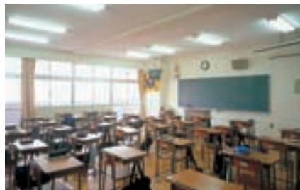
普通教室 A classroom