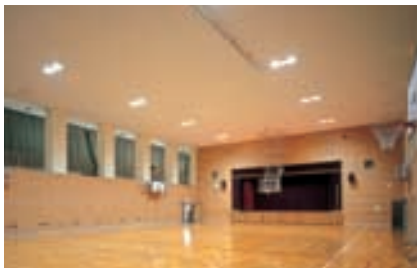
講堂兼体育館 A hall-cum-gymnasium