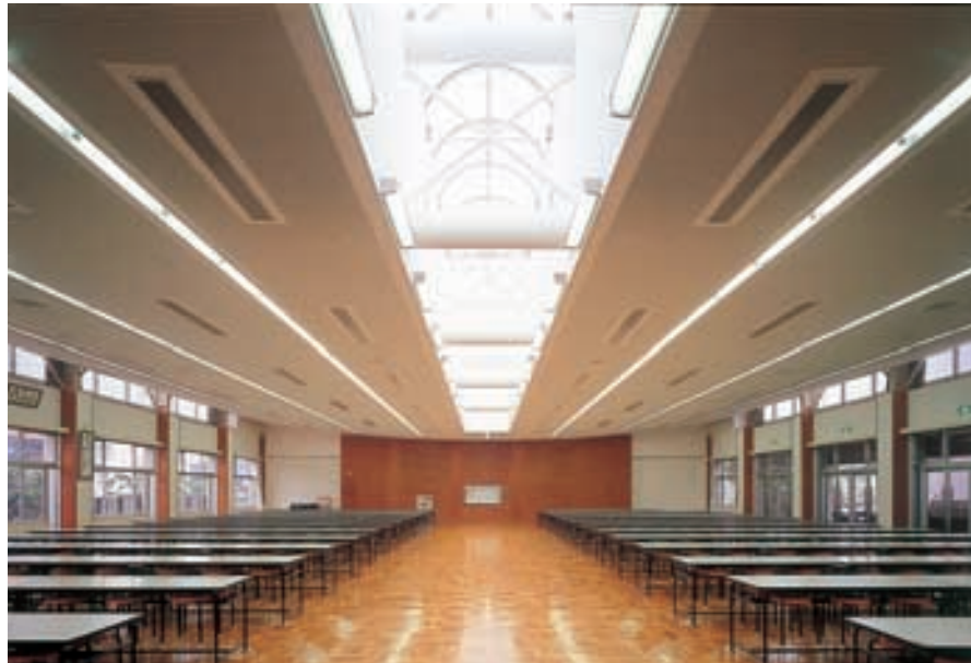
食堂 微妙な反り上がりの天井部分を透過ドームと共に光のラインが走る A dining hall

照明設備は、地域開放に伴う夜間利用と多目的使用を考慮し、多様化する用途に柔軟に対応できる照明空間づくりをコンセプトとしています。多目的ホールは透過式ドーム型天井の2階吹抜構造で、建設時に発掘調査された地層標本を壁面パネルディスプレイとしています。天井部に250W HL-ネオハイドランプ直付形バンクライト電動昇降装置付を6台、2階せり出し部分に同ランプ埋込形ダウンライト8台を設置し、平均照度350 lxを確保しています。また吹抜部に面した2階廊下の250W高演色HQLランプ2灯用投光器により、両サイドからの拡散照射が壁面ディスプレイを浮かび上がらせています。集会なども開催できる食堂には40W蛍光ランプ1灯用埋込器具の24連結が6列3m間隔でライン配置され、中央の透過ドーム(全長24.4m)の内側に40W蛍光ランプ1灯用ブラケット器具を1.3m間隔で10台、2ライン配置し、約750㎡の無柱空間を明るく安らぎのある雰囲気仕上げています。