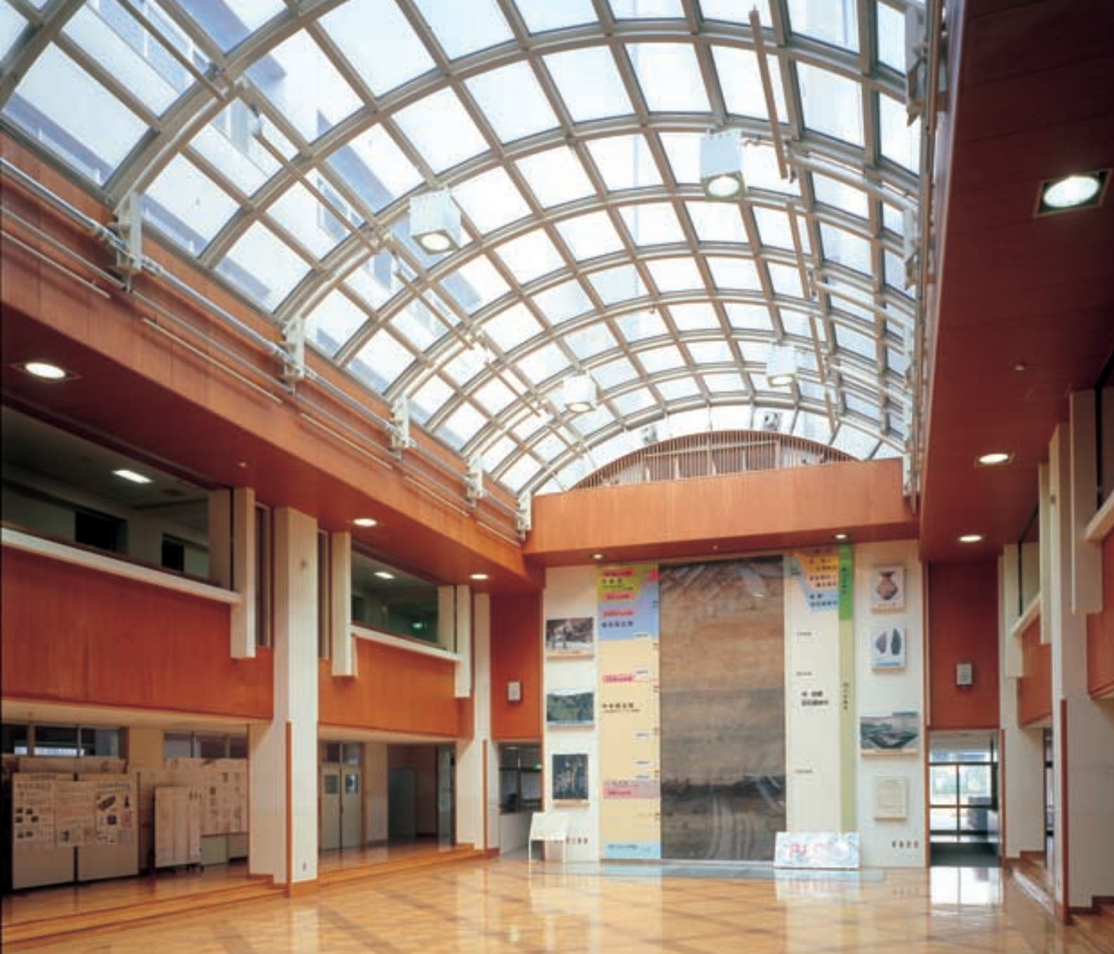
多目的ホール トップライトからの自然光と調和した照明設備。壁面ディスプレイを美しく浮かび上がらせている A multi-purpose hall