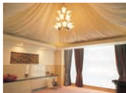
ロビー Lobby シャンデリアを中央に配置して、天井のカーテン越しの光で落ち着いた雰囲気演出。