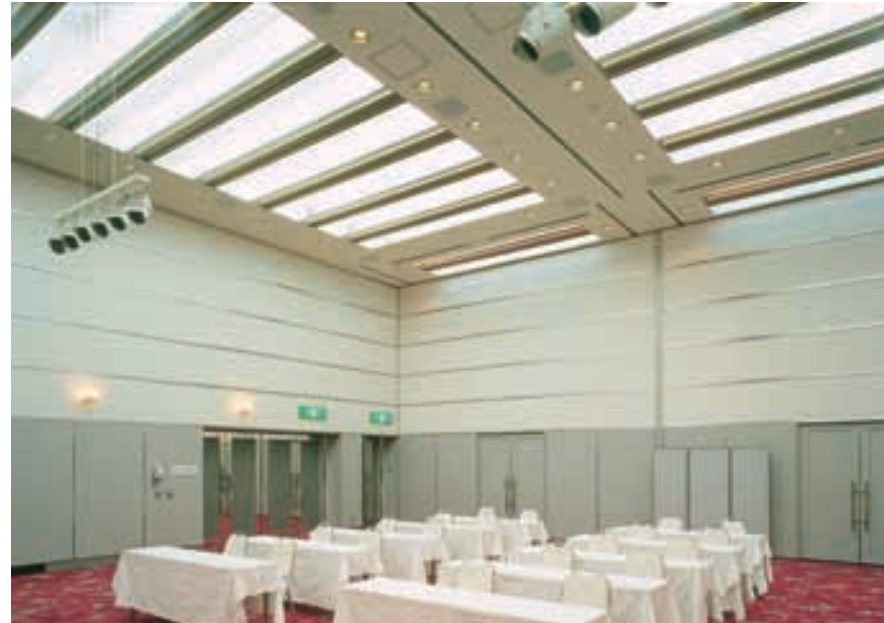
バンケットホール(全点灯時) 細管環形蛍光灯をベース照明とし、明るく落ち着いた印象に上げている。 Banquet hall (with all lights illuminated) (RGBW調光用)