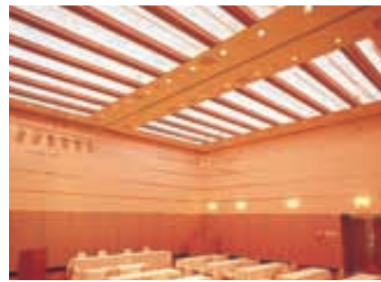
バンケットホール 赤色カラーランプ点灯時 Banquet hall