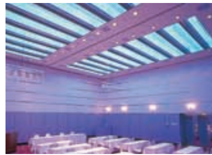
バンケットホール 青色カラーランプ点灯時 Banquet hall