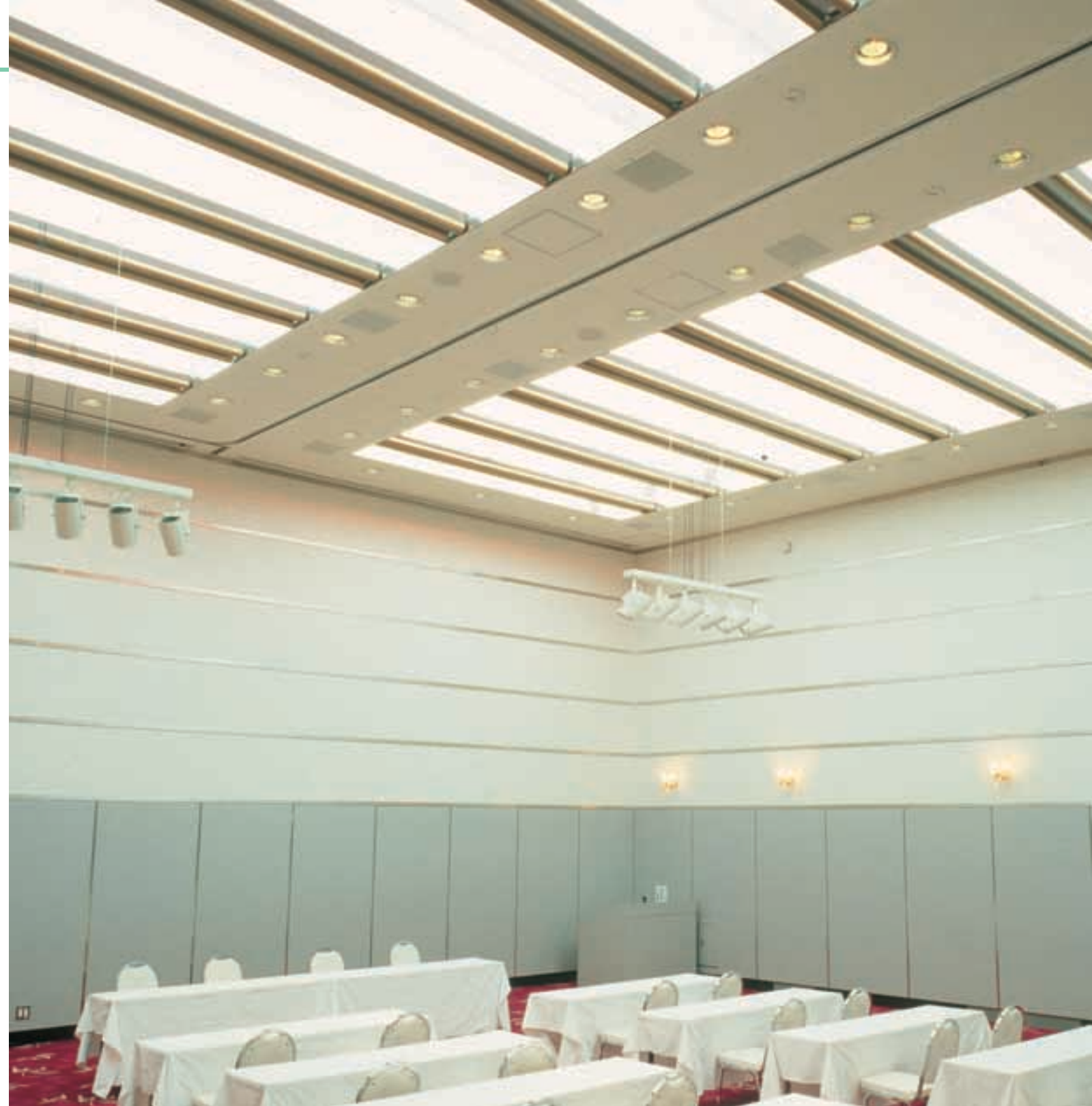
バンケットホール(全点灯時) シャンデリアを中央に配置して、天井のカーテン越しの光で落ち着いた雰囲気演出。