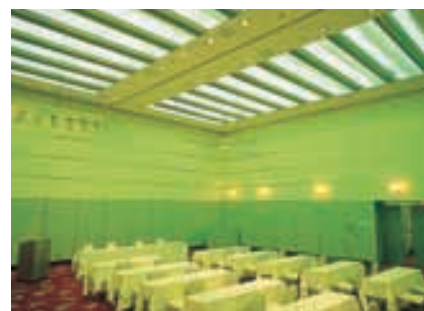
バンケットホール 緑色カラーランプ点灯時 Banquet hall