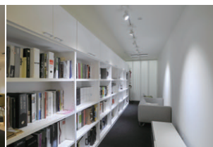
最新カタログが配置されているライブラリーコーナーのLED照明