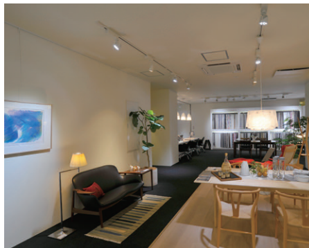
LEDスポットライトを主体に随所にHIDスポットライトを配置