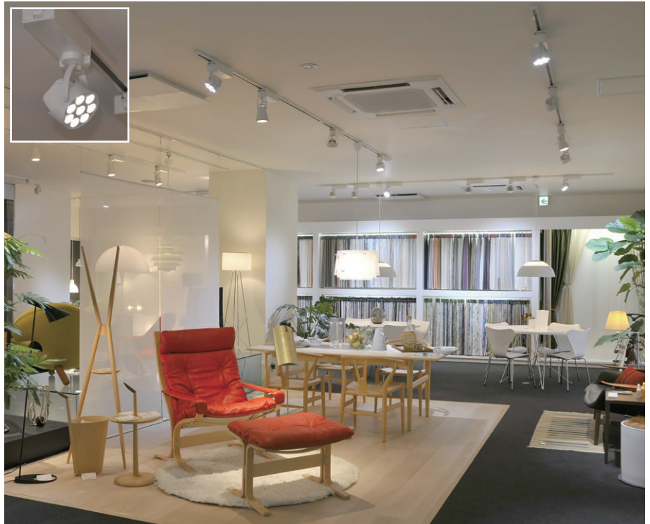
国内外のインテリアブランド、家具などを展示されているコーディネートシーンコーナーの照明 LEDスポットライトライティングレールタイプにより指向性の照射光で効果的に演出

また、低消費電力による省エネ（消費電力：HIDスポットライト比約45%削減）はもちろん、長寿命40,000時間による大幅な省メンテも図られています。