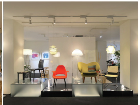
入口正面の展示照明 HID照明のスポット光で店内への引き入れ空間を演出