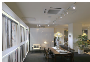
紫外線や熱線がほぼゼロのLEDで商品の色褪せを防止