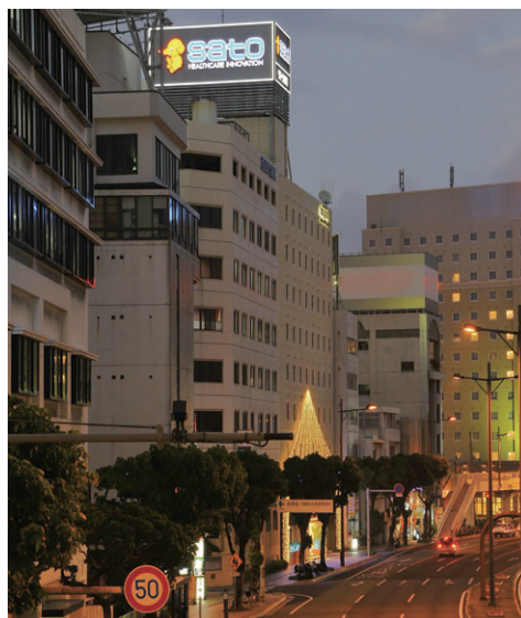
車道を手前にしてLED仕様の広告塔の夜景を望む