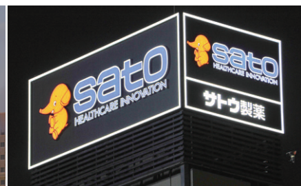
LED看板用モジュールにより明るく表示された広告塔