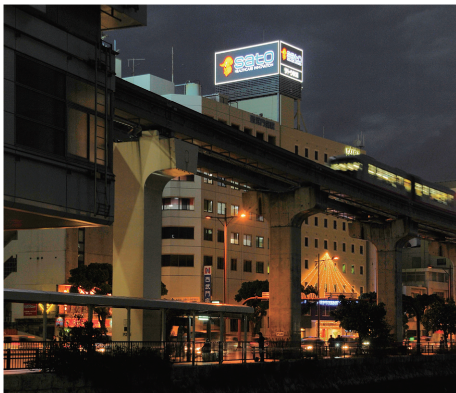
沖縄都市モノレール旭橋駅の架橋からLED仕様の広告塔の夜景を望む