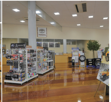
カー用品コーナーから受付コーナーを望むLED照明