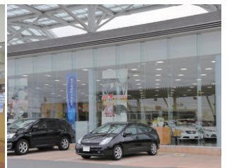
ガラス越しに内部を望む LEDのきらめき光でカーショールームの存在感を高めている