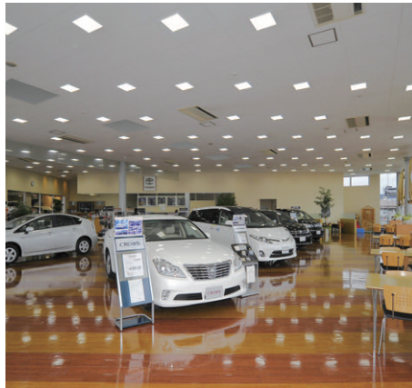
内部の道路沿い側から店内奥を望むLED照明