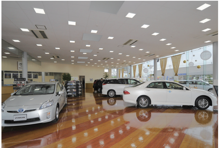
メタルハライドランプダウンライトから先進のLEDベースライトスクエアタイプに更新されたカー・ショールーム内観

このほか、トイレではLEDダウンライトと人感センサーによるON/OFF制御でムダなあかりをカットしてさらなる省エネが図られています。