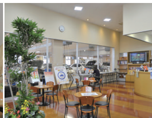
整備中の車を眺められるサービス待合コーナーのLED照明