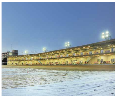
フェアウェイ右側から見たLED照明