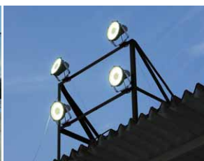
屋根上に設けた照明やぐら