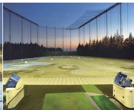
2階打席から見た良好なフェアウェイの照明