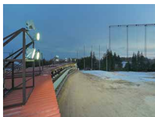
照明やぐらからフェアウェイを望む