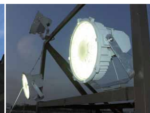
低消費電力のLED投光器