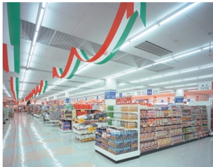
店舗中央の日用雑貨・食品売場 Daily household goods and groceries floor in the middle of the store floor 高周波点灯専用コンパクト形蛍光ランプを採用。省エネ照明システム“SESL”との組合せで、明るくしかも省エネを実現

「グランリバー」は、計画から10余年の歳月をかけて完成した複合型の本格ショッピングタウンです。「ザ・コンボ」は、左側にスーパーマーケット、右側にドラッグストアとなっており、面積比率はほぼ6:4に大きくゾーニングされています。天井を高くゴンドラは低めに設定されており、商品を見やすく分かりやすい売場環境をつくり出しています。ゴンドラが設置されている日用雑貨、食品売場の照明設備には、105W高周波点灯専用コンパクト形蛍光ランプを採用した“Hf コーライン S”逆富士形器具(2灯用連結器具)を設置しています。自然な色合いで演色性に優れ、省エネ形で長寿命のあかり特性をもっている照明器具で、これを天井(4.7m高さ)に3.2m間隔で10列を横にライン配置しています。また、省エネ照明システムSESLを採用し、消費電力量(ランニングコスト)の削減を図っています。70%調光で1400 lxが得られています。野菜、青果売場の照明は方向性をもたないスクエアタイプのコーラインシリーズ“スーパーソフト”を整列配置で設置し、均斉度が高く光ムラのない活気ある売場空間をつくり出しています。