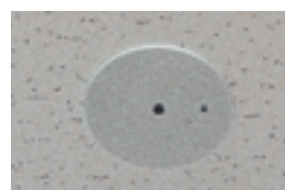
あかりセンサ Sensor for illumination intensity 省エネ照明システム“SESL”で効率的な照明運営を実施