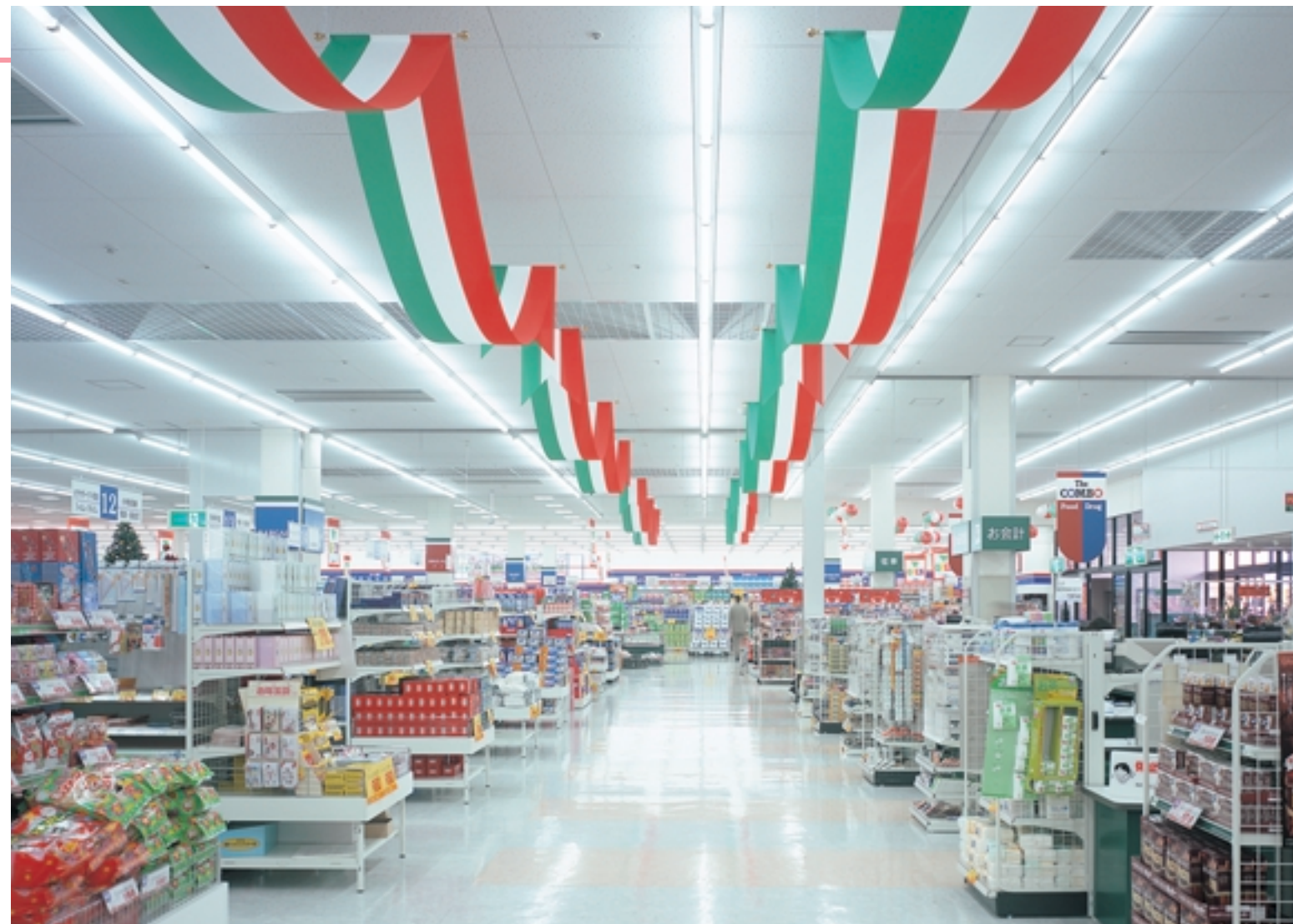
店舗中央の日用雑貨・食品売場 コンパクト形蛍光ランプ“Hf コーライン S”2灯用連結器具を採用。SESLとの組合せで明るく、しかも省エネが実現。 Daily household goods and groceries floor in the middle of the store floor