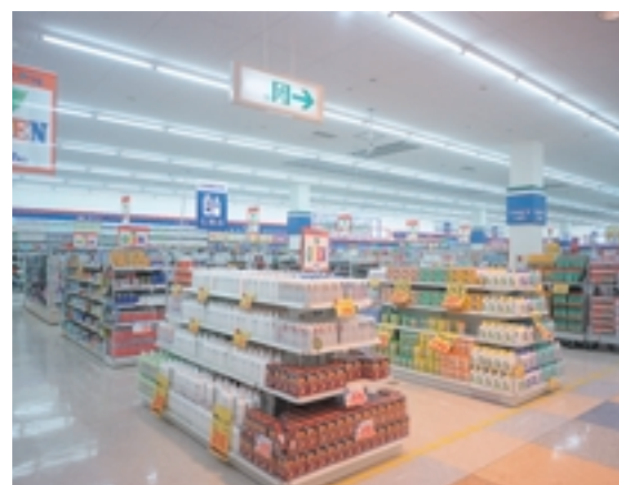
売場左側のドラッグストアゾーン Drug store zone located at the left side on the floor 什器の高さも抑えられ商品がアイテムごとに見やすく陳列されている。隣のフーズコーナー部の低色温度の空間とよく対比されている