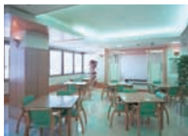
デイルーム・食堂 Day-room/Dining room

折り上げ天井は間接照明とし、下がり天井部には55Wユースラインフラット2灯用埋込器具パツフル付を設置