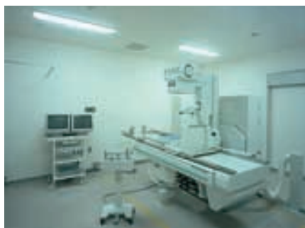
X線室 X-ray room

各科の診察室には32W2灯用Hf-Lco(ロコ)埋込器具下面開放を採用。外光とのバランスやスクリーンの仕切等で照明器具の配置バランスを考慮している