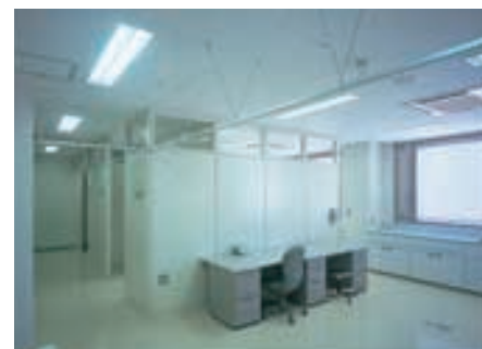
診察室 Consultation room

Hf32W3灯用特注クリーンルーム用器具を連結設置で口の字形に配置し、明るく、均斉度のよい、なおかつ清潔感のある照明空間を実現している