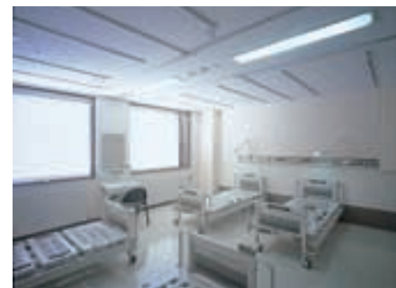
2人部屋病室 Ward room with two-bed

待合室には36Wユースラインフラット2灯用埋込器具パツフル付を設置し、明るく、清潔感あるなか落ち着いた雰囲気をもも出し出している。受付前の折り上げ天井には間接照明により、開放感と安らぎ感、快適性を演出している