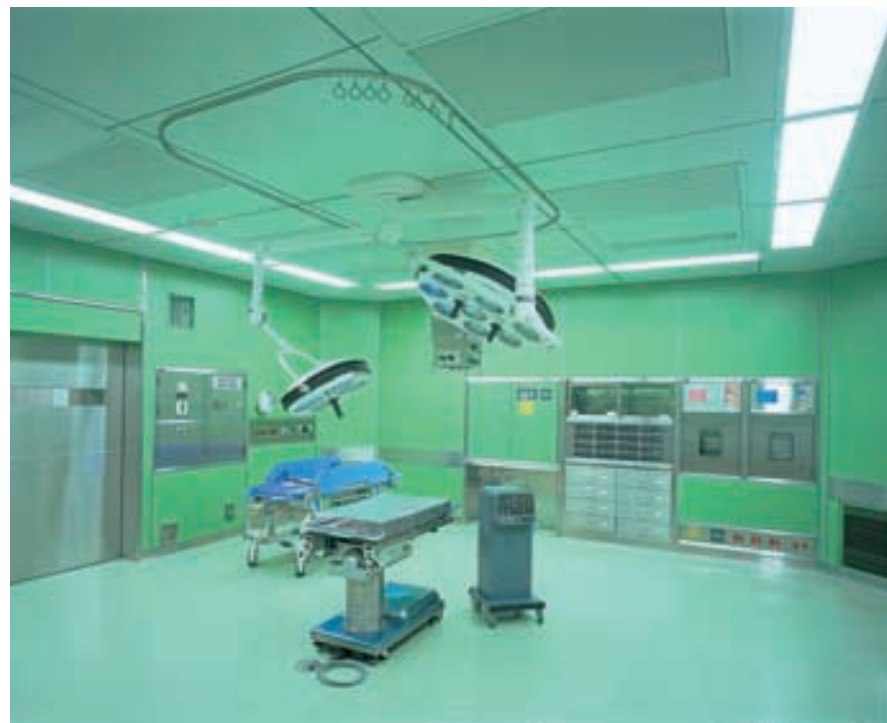
手術室 Operation room

Hf32W3灯用特注クリーンルーム用器具を連結設置で口の字形に配置し、明るく、均斉度のよい、なおかつ清潔感のある照明空間を実現している