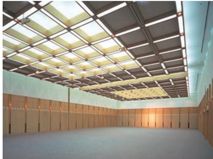
小展示室(1) Small Exhibition Hall (1) 建築化照明が施され、手動調光器で多彩な照明パターンを創り出している

大展示室は様々な用途に対応できるように、グループ制御、パターン制御を可能にするシステムを導入 小展示室は催しものにふさわしい照明のイメージづくりと多彩な照明パターンをつくり出せる演出