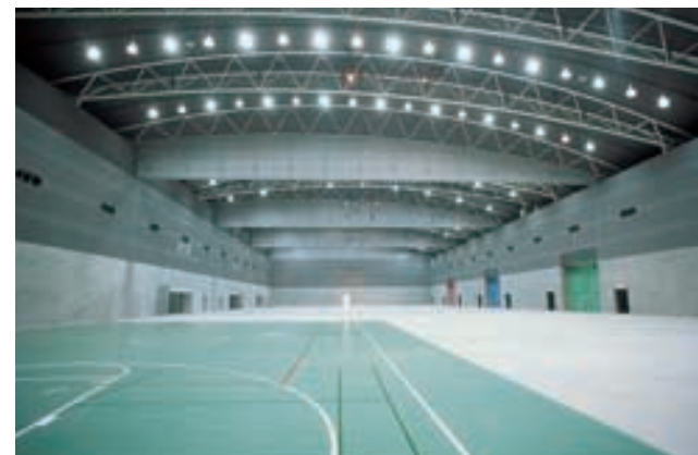
大展示室を正面より望む View of the Large Exhibition Hall from the entrance