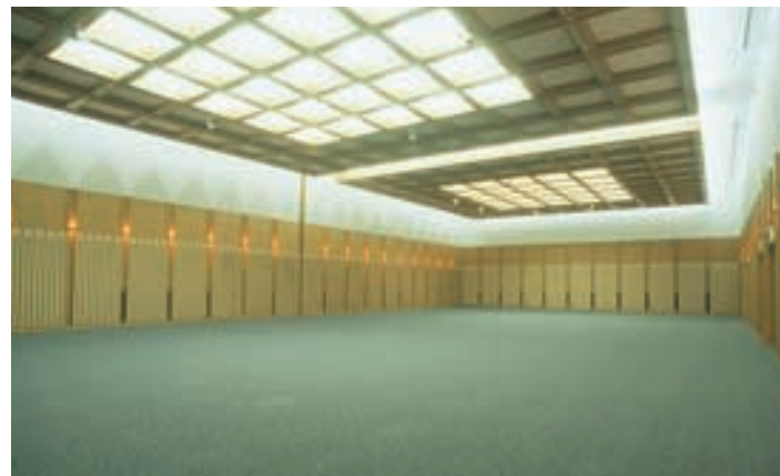
小展示室(2) Small Exhibition Hall (2) 折り上げ上部のみの照明パターンで天井のイメージを演出