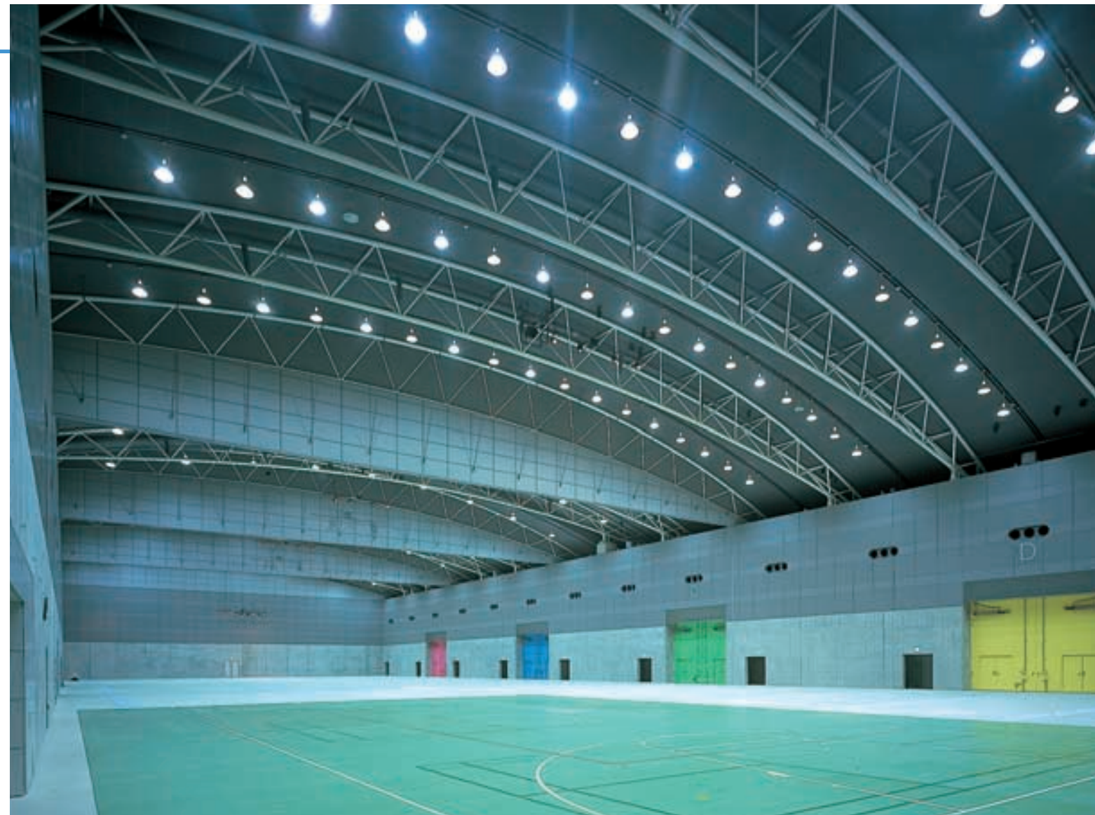
大展示室 Large Exhibition Hall メタルハライドランプ反射笠器具252台と照明制御システムにより、省エネをはかると共に用途に対応した快適照明空間を実現