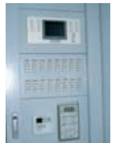
大展示室の照明をグループ制御、パターン制御を行う照明制御システム