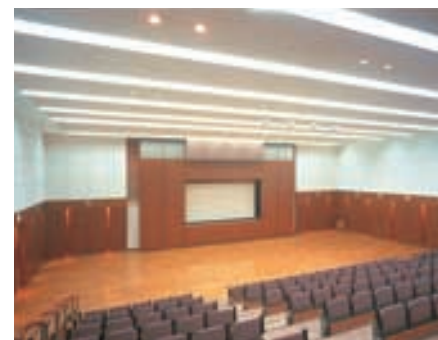
研修室 Seminar Room 用途別に使い分けを可能にした建築化照明