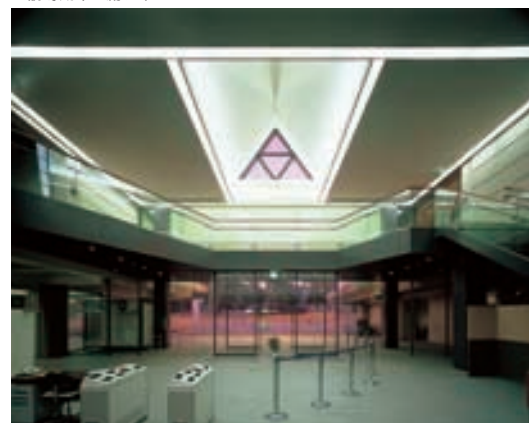
エントランスホールの照明 Lighting in the Entrance Hall 上部2面より自然光を採光し、合わせて直線状に施した蛍光灯器具をルーバーによりクリアを抑えている