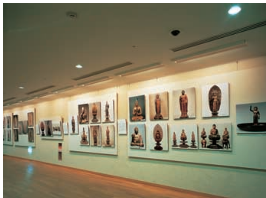
地下回廊 The basement corridor コンパクト形蛍光灯埋込器具とウォールウォッシャー埋込器具を使用して、展示品を効果的に照射していると共に、スムーズに新館への誘導効果を生み出している

間接照明によりソフトで親しみをつくり出すと共に展示ケースとのバランスのよい照明環境を創出 展示品の色あせを軽減