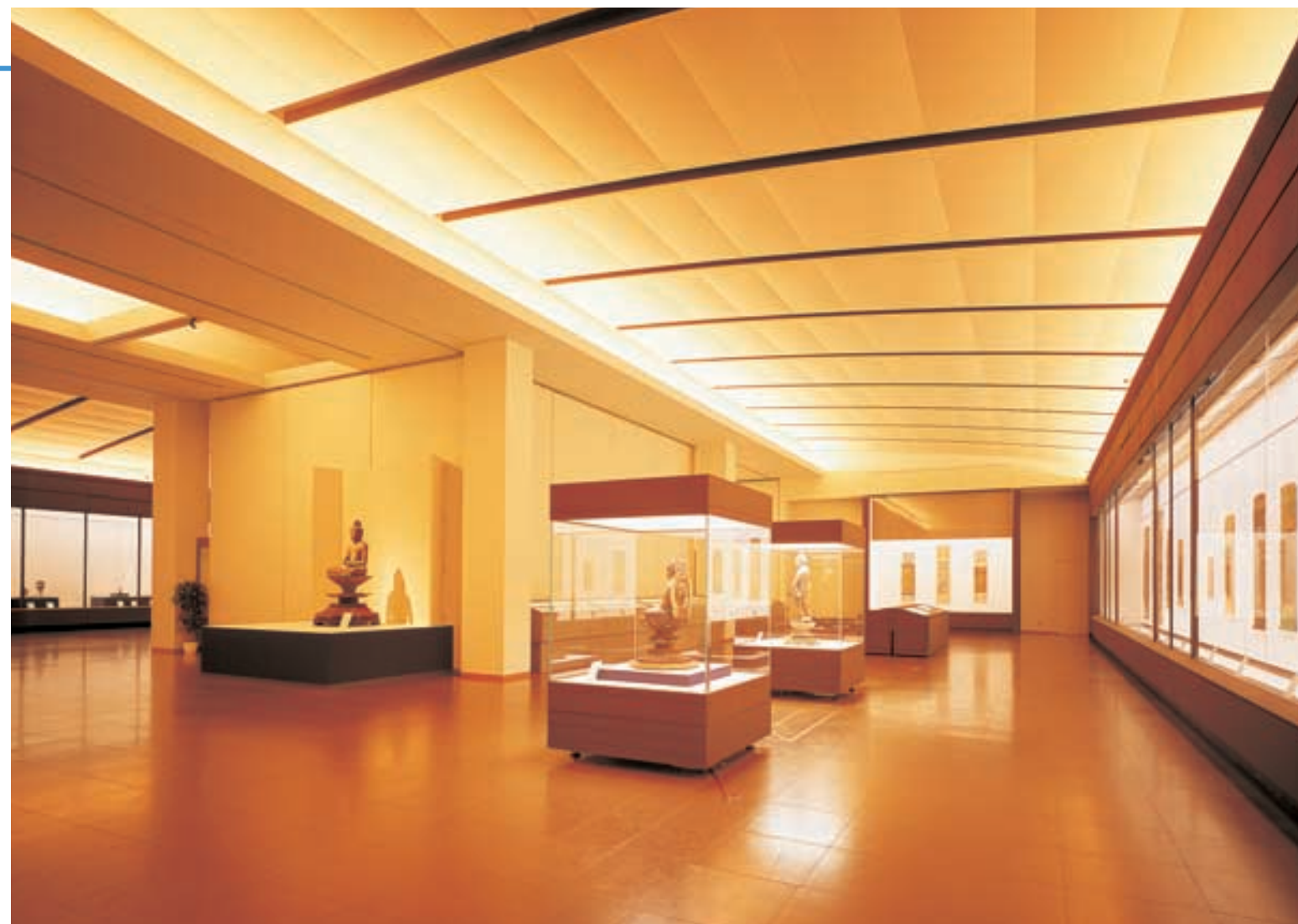
大展示室 Large Exhibition Hall 建築化照明により光天井のイメージを創り出し、展示ケースとのバランスのよい照明環境が得られている