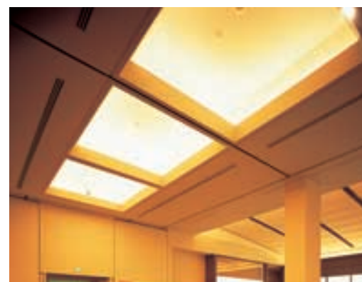
建築化照明によるベース照明(2) Base lighting achieved with architectural lighting (2) 格子状の折り上げ天井から間接照明で柔らかな光を演出