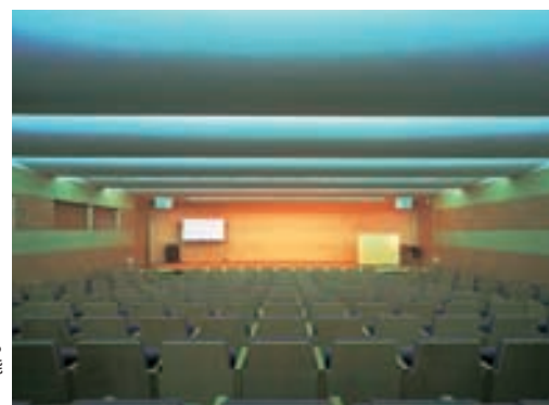
講堂の照明 Lighting in the Auditorium 間接照明により落ち着いた雰囲気を出すと共に調光により多様な場面に対応可能としている