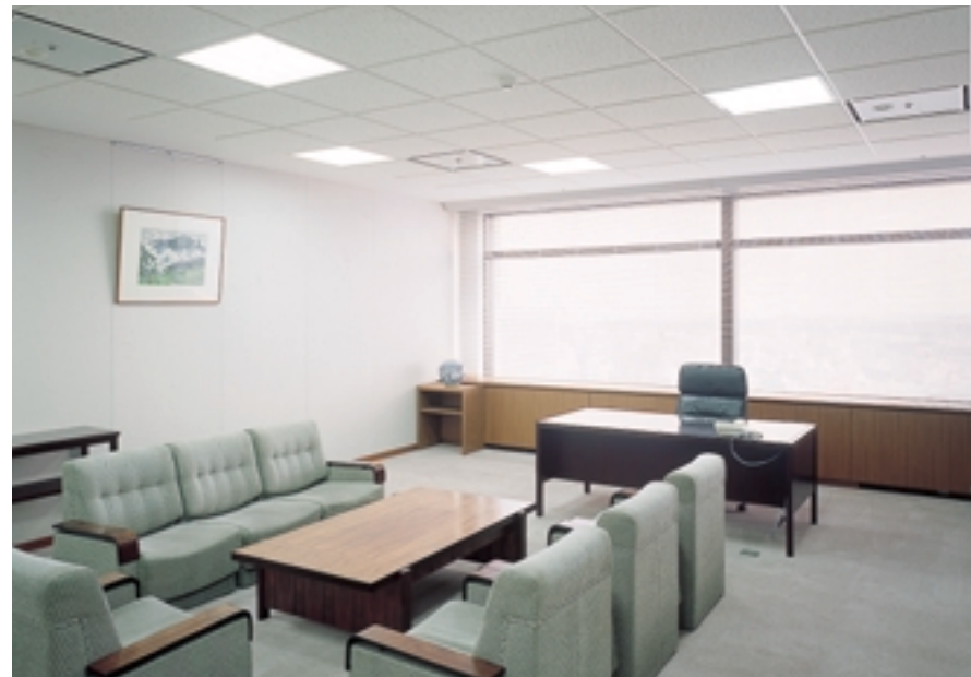
応接スペース 落ち着いた空間にも違和感を感じさせない。 A reception room