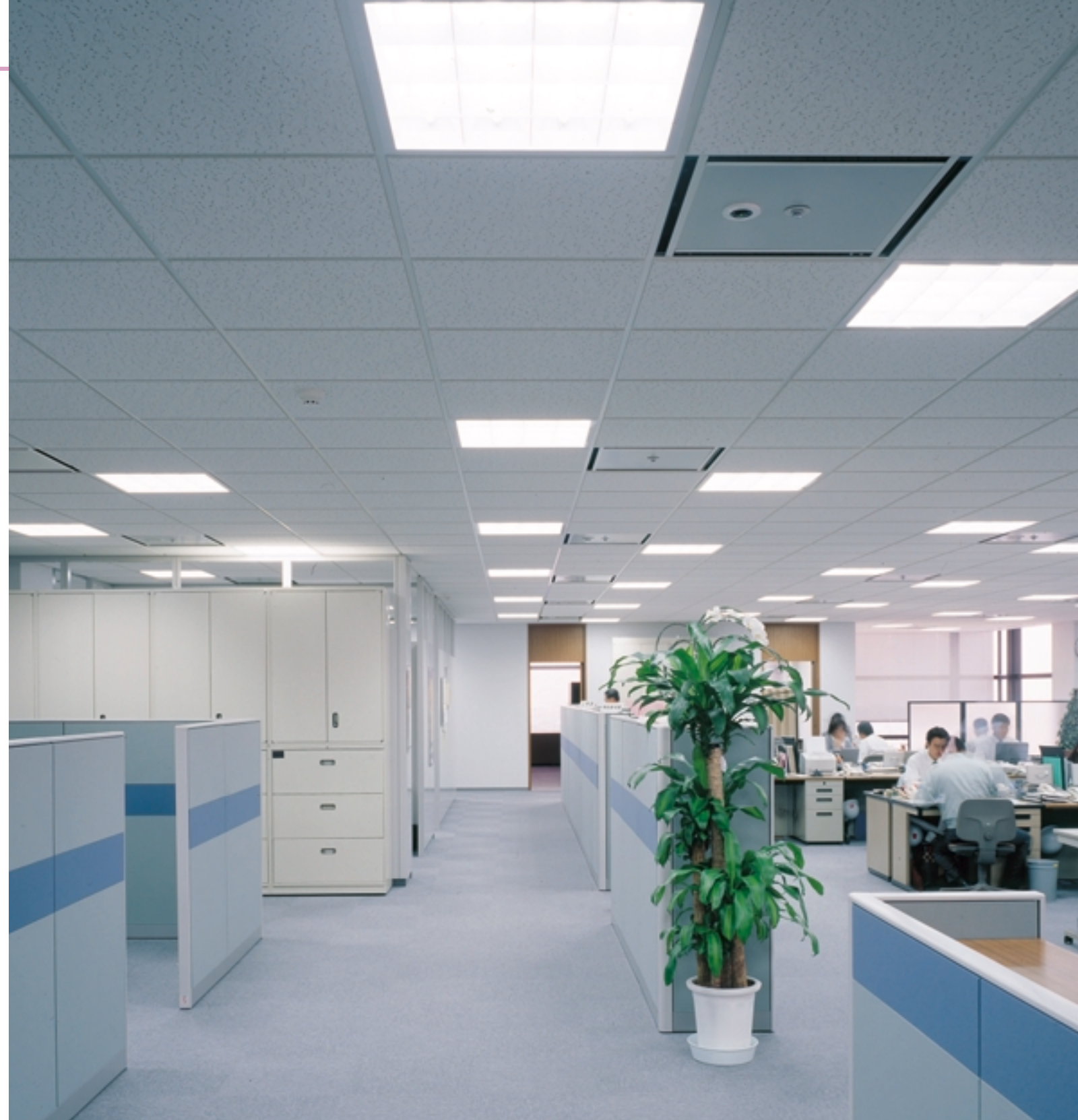
事務スペース 照明の立場から過ごしやすい環境を形成している。 Office floor