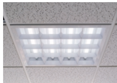
Hfシリーズ システム天井用器具 Hf series