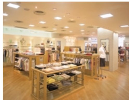
店舗内奥に広がる売場

ベース照明と重点照明をバランスよく併用して高質な照明環境を維持する。 商品をわかりやすく楽しく演出できる照明環境を実現する。