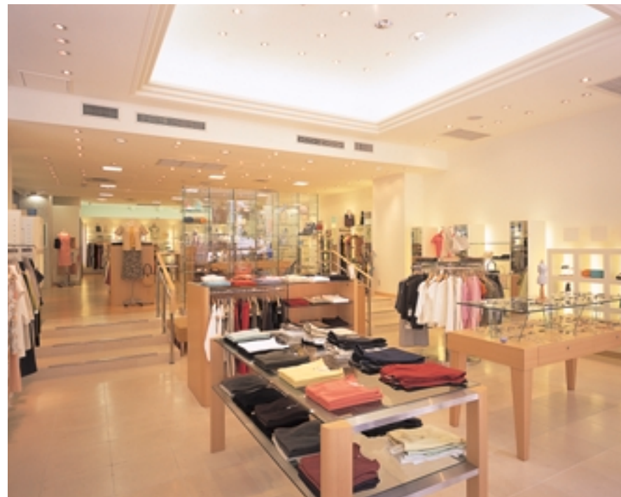
入口近くの店舗内 Store floor near entrance

入口近くに設けられた折上天井はそのまま残し、店舗間の壁をとることによって、開放感のある空間を生かす照明演出を行っています。具体的には間接照明による柔らかな光とウインドー面を強調することと、奥へと導くための工夫がなされています。その結果、商品をわかりやすくしかも楽しく演出できる心地よい空間に仕上がっています。奥に広がる売場のベース照明には、方向性をもたないユーラインスクエア350mmを設置し、光ムラのない活気ある商空間をつくり出しています。重点照明にはローボルトハロゲンユニバーサルダウンライトを採用し、全ての商品の一つひとつ鮮やかに引き立たせていると共に、温かみのある空間を演出しています。