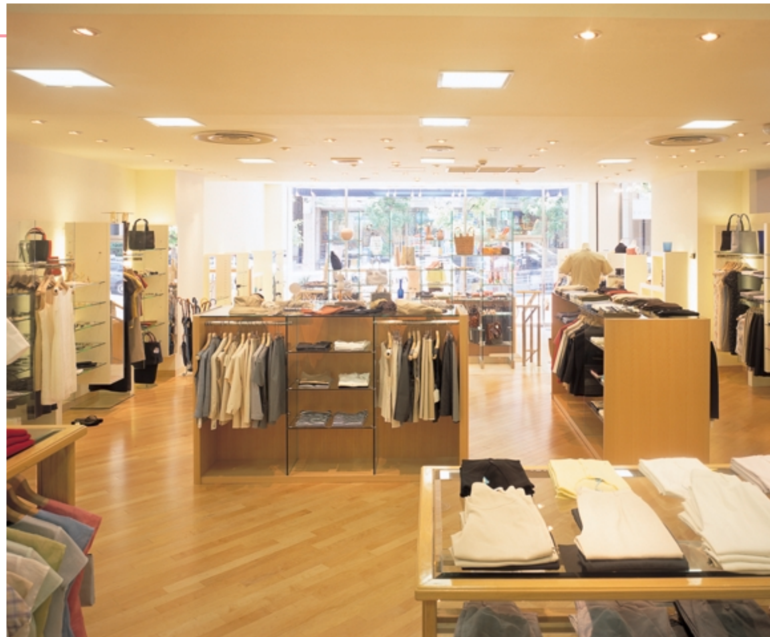
奥の店内から入口方向を臨む 明るく柔らかくオープンな雰囲気演出 Viewing in the direction of entrance from the innermost corner

折上天井の間接光には昼光色と電球色の蛍光灯を採用し、色温度の混光変化を調整して照明演出